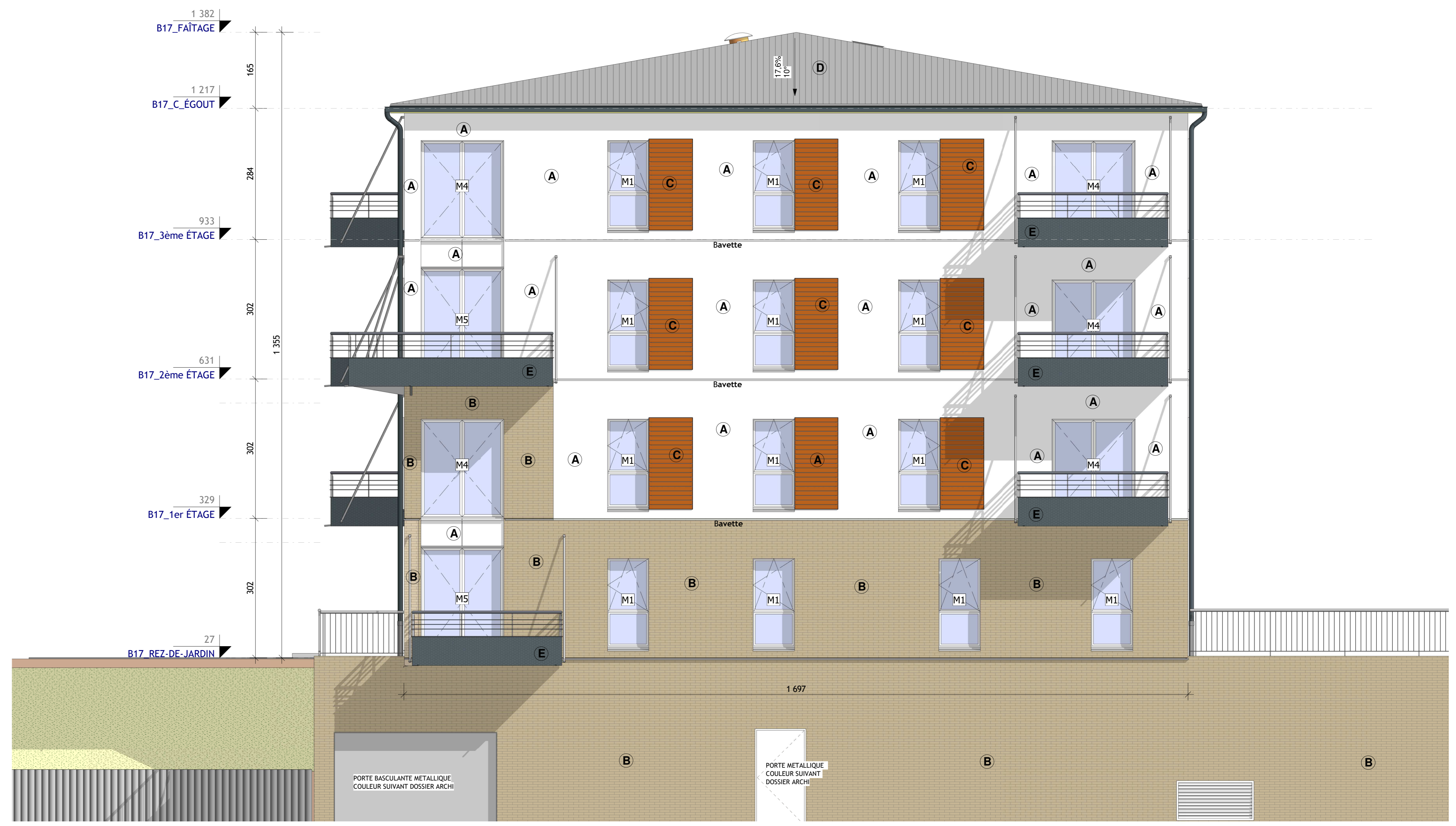
1- B17 - Élévation EST 1:50