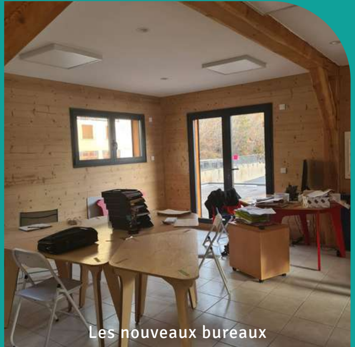
Les nouveaux bureaux

En attendant, vous pouvez déjà noter notre nouvelle adresse : 49 route de Grenoble, 05100 Briançon