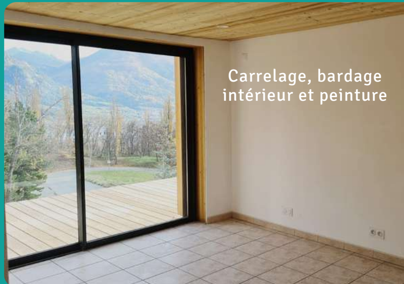
Carrelage, bardage intérieur et peinture

Au fur et à mesure de l'avancée des travaux, l'Écrin prend vie et devient presque habitable : le carrelage est posé à 90%, les peintures sont désormais terminées ainsi que le bardage intérieur.