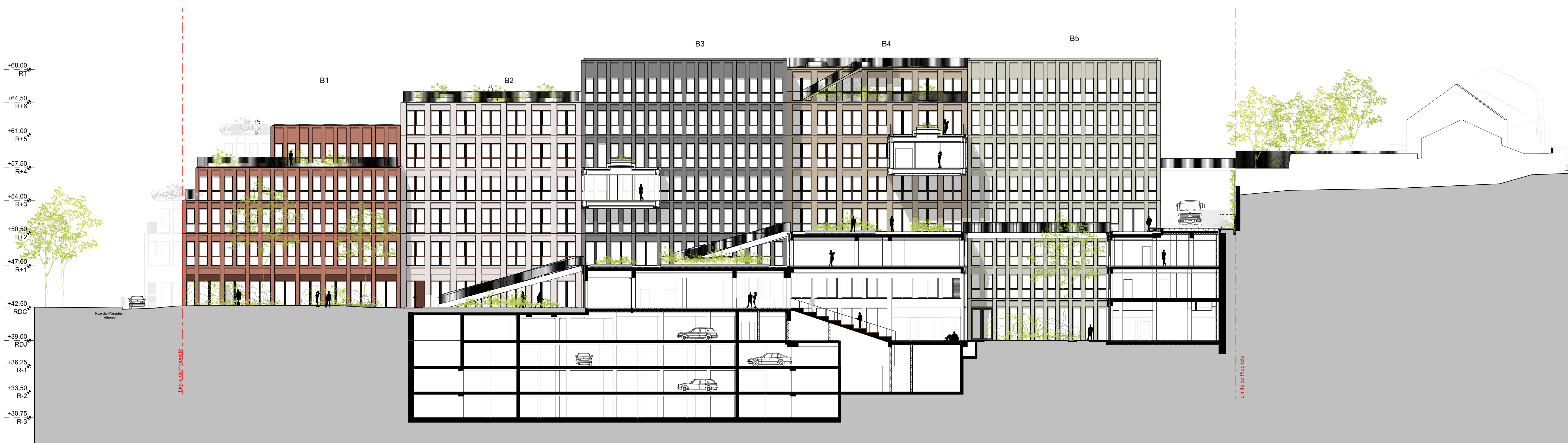
Coupe AB Vallée 1