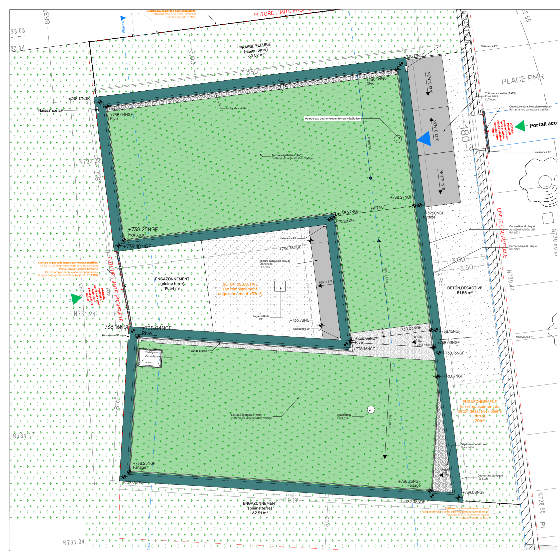
DOE-PLAN - TOITURE (738.37NGF) échelle 1:100