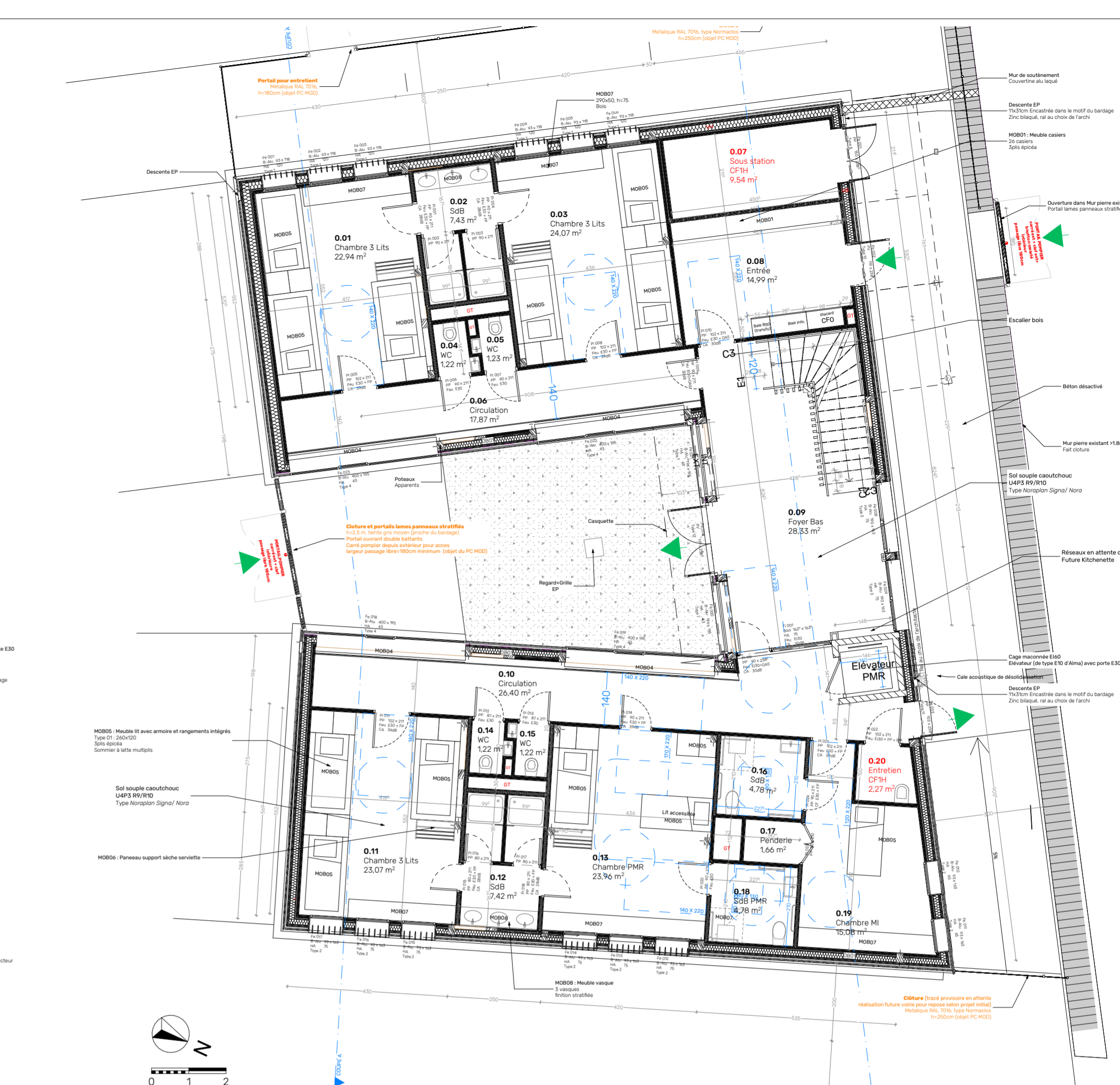
PLAN - REZ-DE-CHAUSSEE échelle 1:100