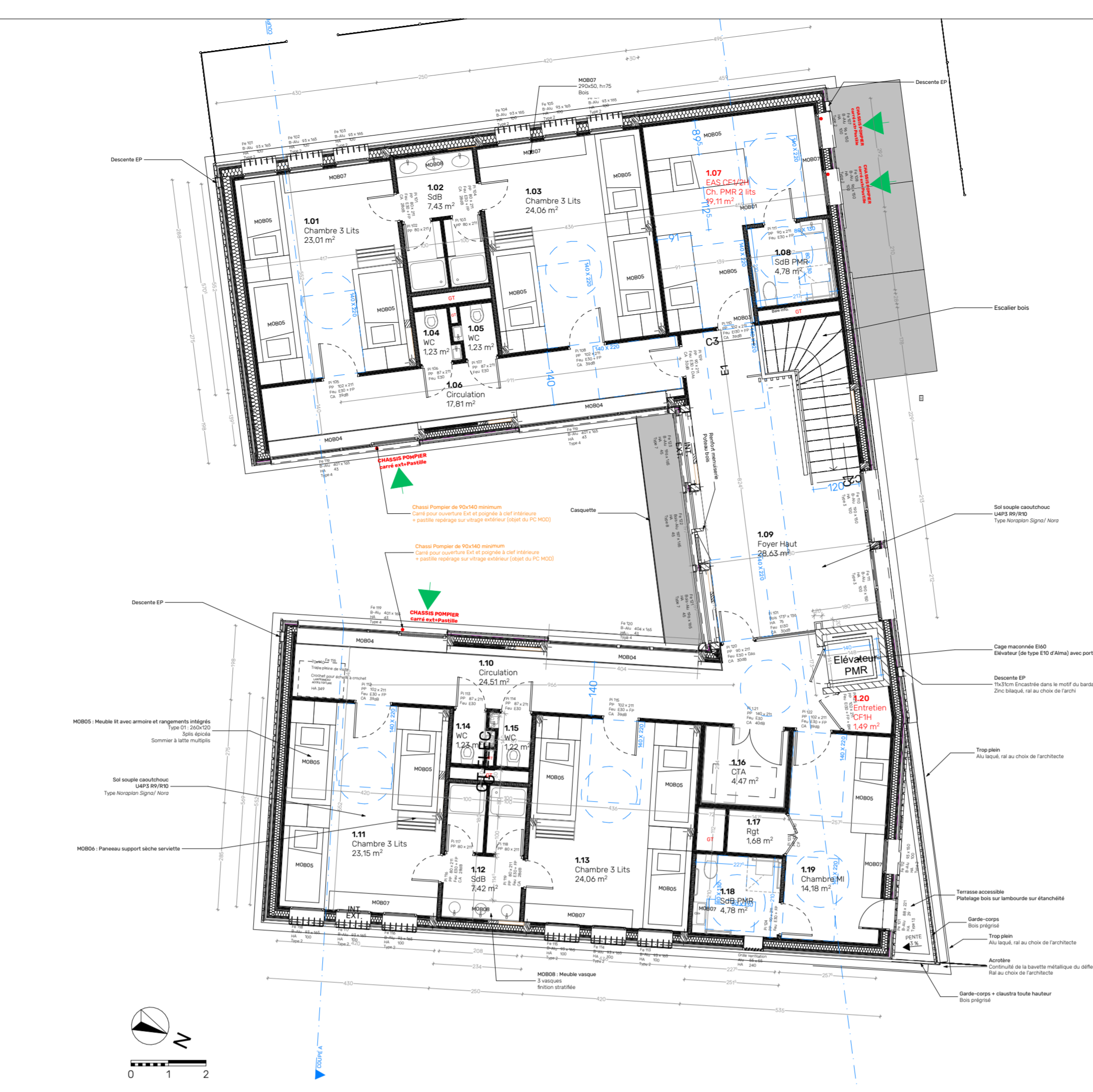
DOE-PLAN - R+1 (734.57NGF) échelle 1:100