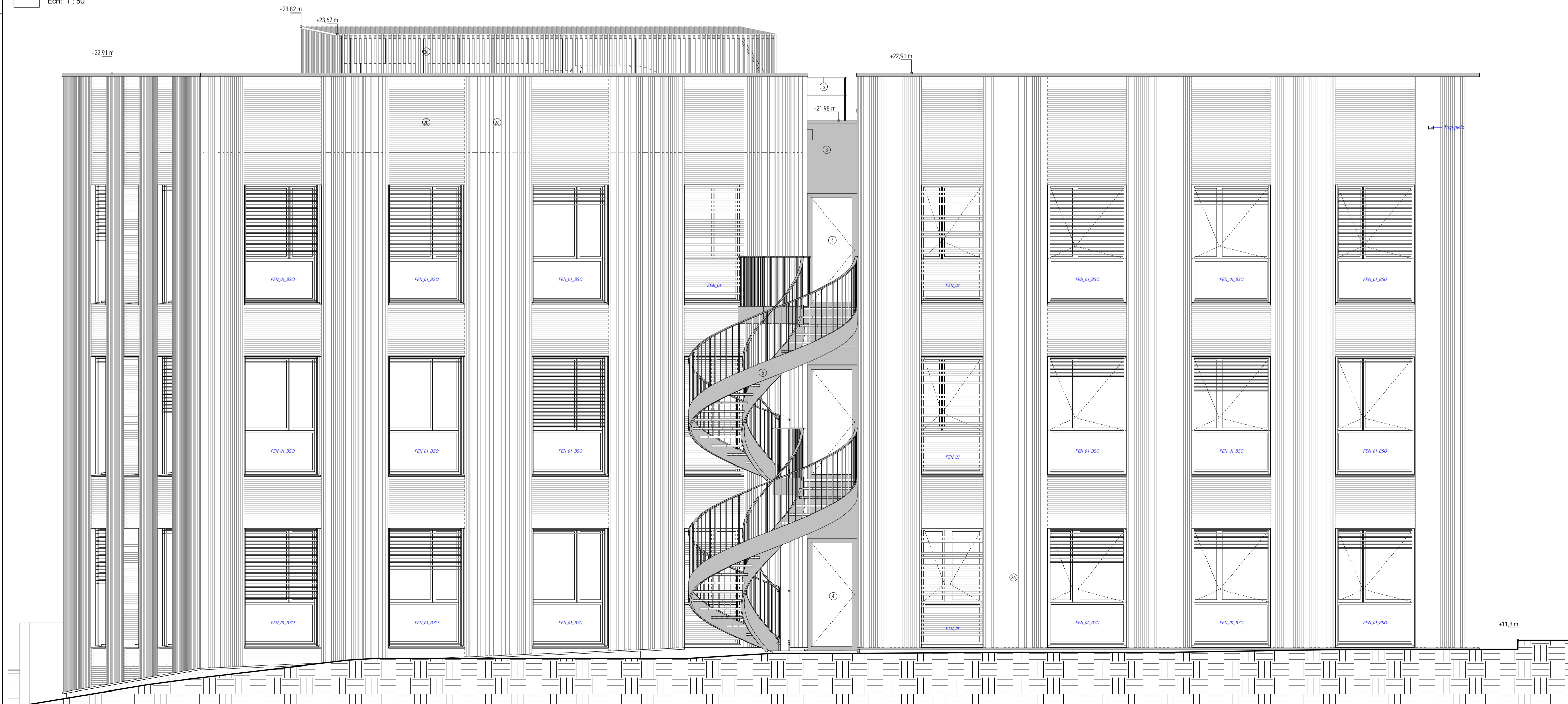
2 Elévation Sud Ech: 1 : 50