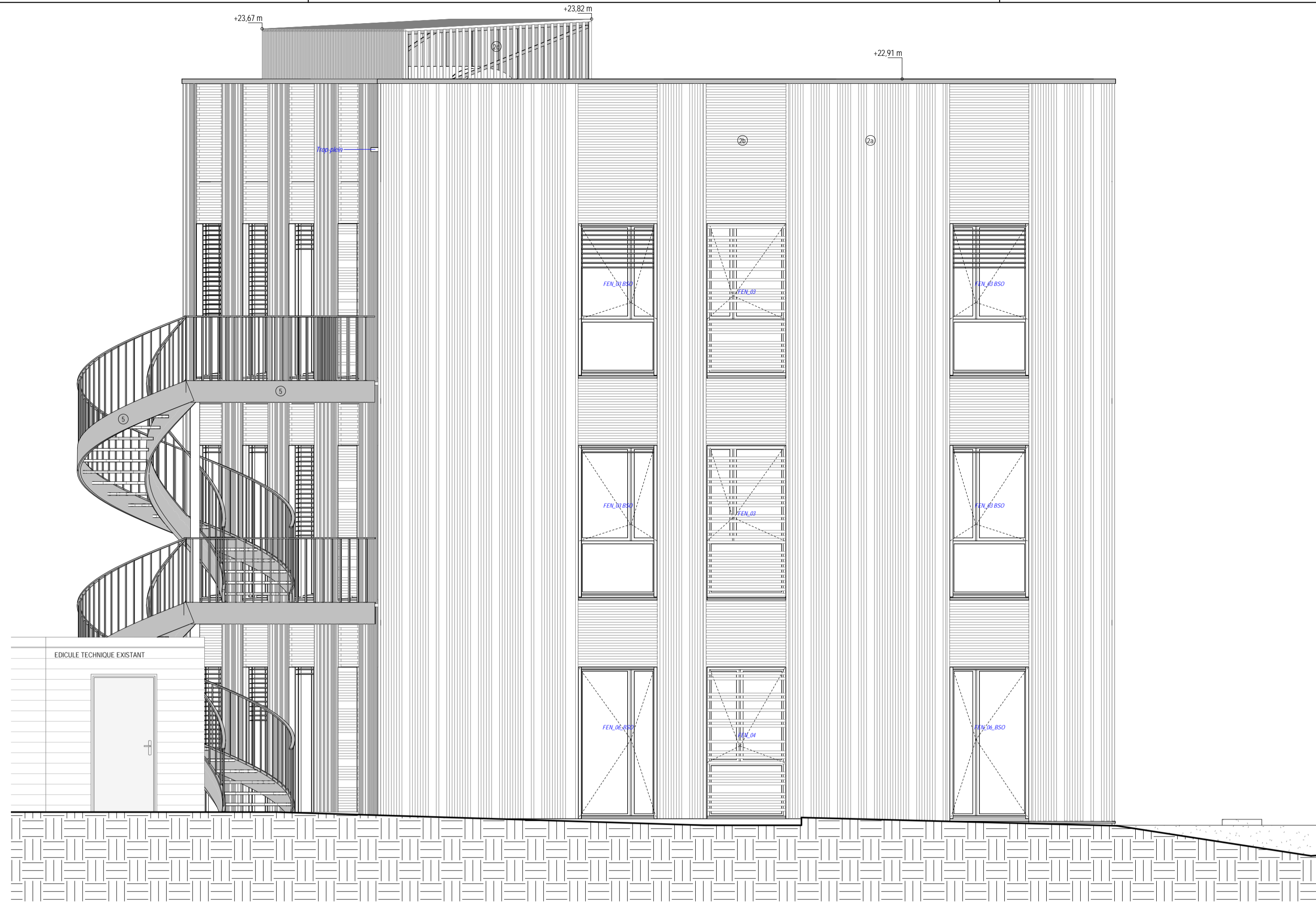
3 Elévation Est Ech: 1 : 50