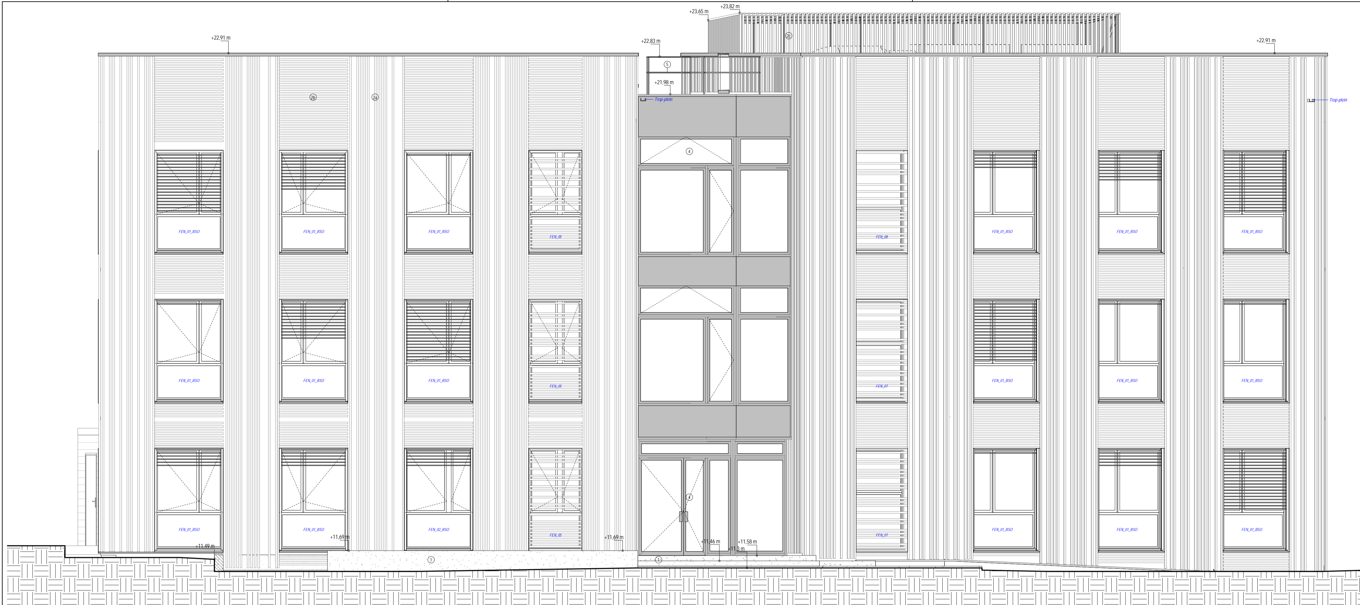
1 Elévation nord Ech: 1 : 50