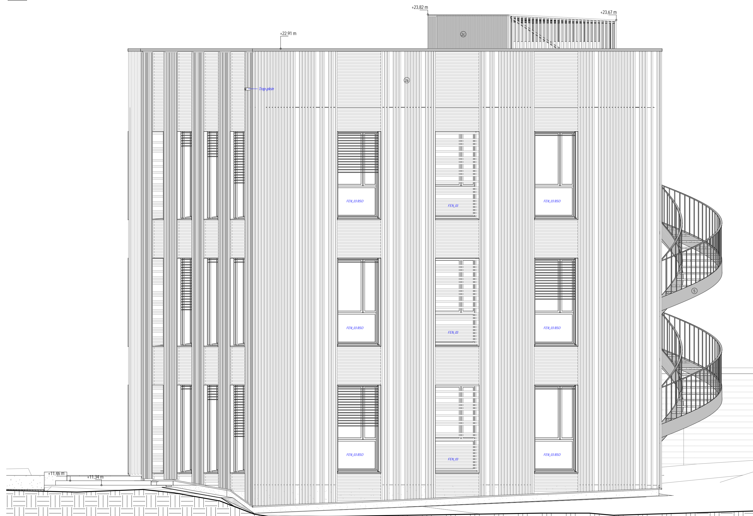
4 Elévation Ouest Ech: 1 : 50