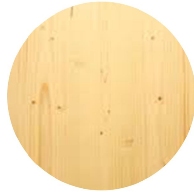
Panneaux de bois en partie basse