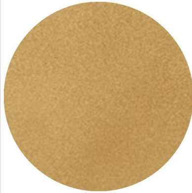
Enduits terre crue intérieurs