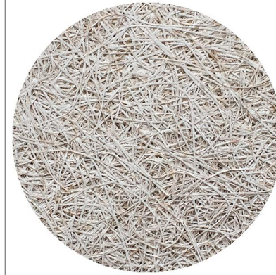
Panneaux acoustiques en fibralith