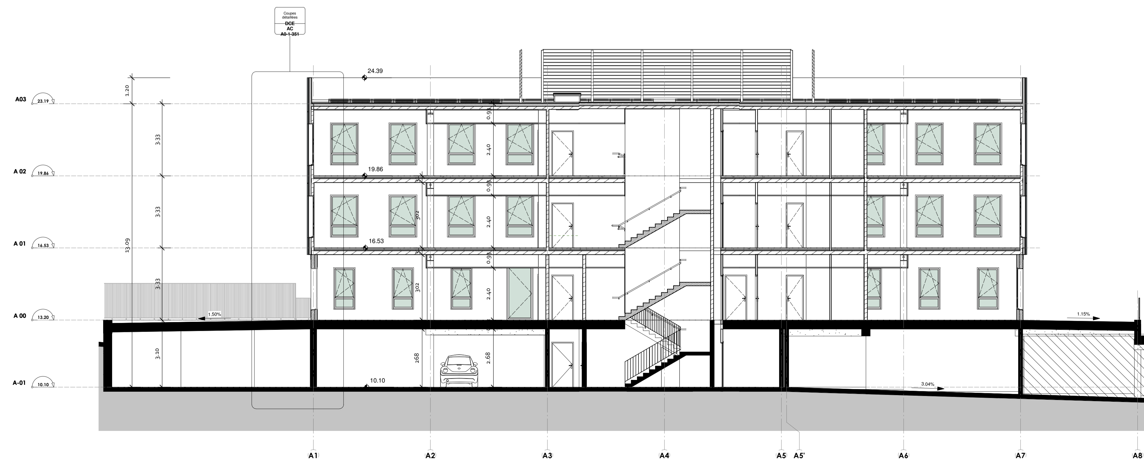
Coupe A1 1:100