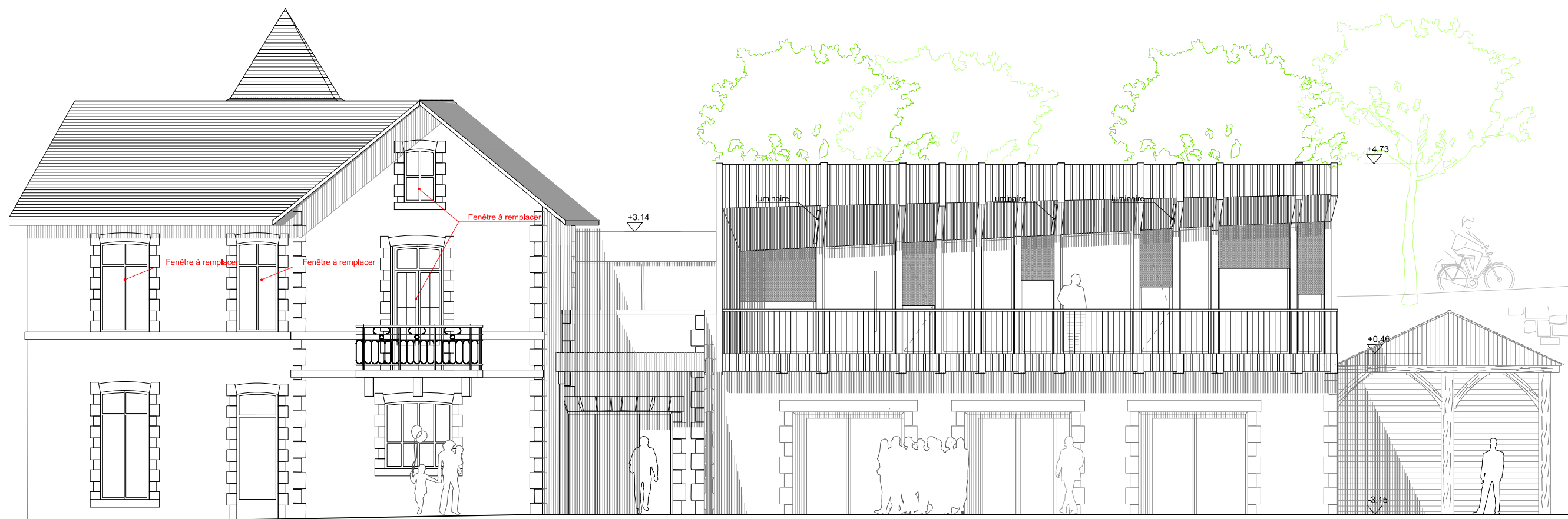
FACADE OUEST 1/100