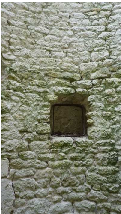
Niche dans le mur

Le mur du moulin est percé de deux fenêtres orientées vers l'Est