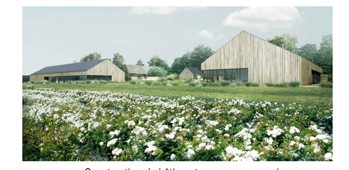
Construction de bâtiments pour une roseraie Route de Baslais - 50320 La-Haye-Pesnel

Ce document n'est pas un document d'exécution. Les entreprises doivent réaliser elles-mêmes leurs plans d'exécutions et relevés pour les soumettre à l'équipe de maîtrise d'oeuvre.