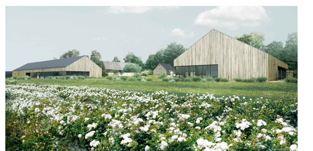
Construction de bâtiments pour une roseraie Route de Baslais - 50320 La-Haye-Pesnel

Ce document n'est pas un document d'exécution. Les entreprises doivent réaliser elles-mêmes leurs plans d'exécutions et relevés pour les soumettre à l'équipe de maîtrise d'œuvre.