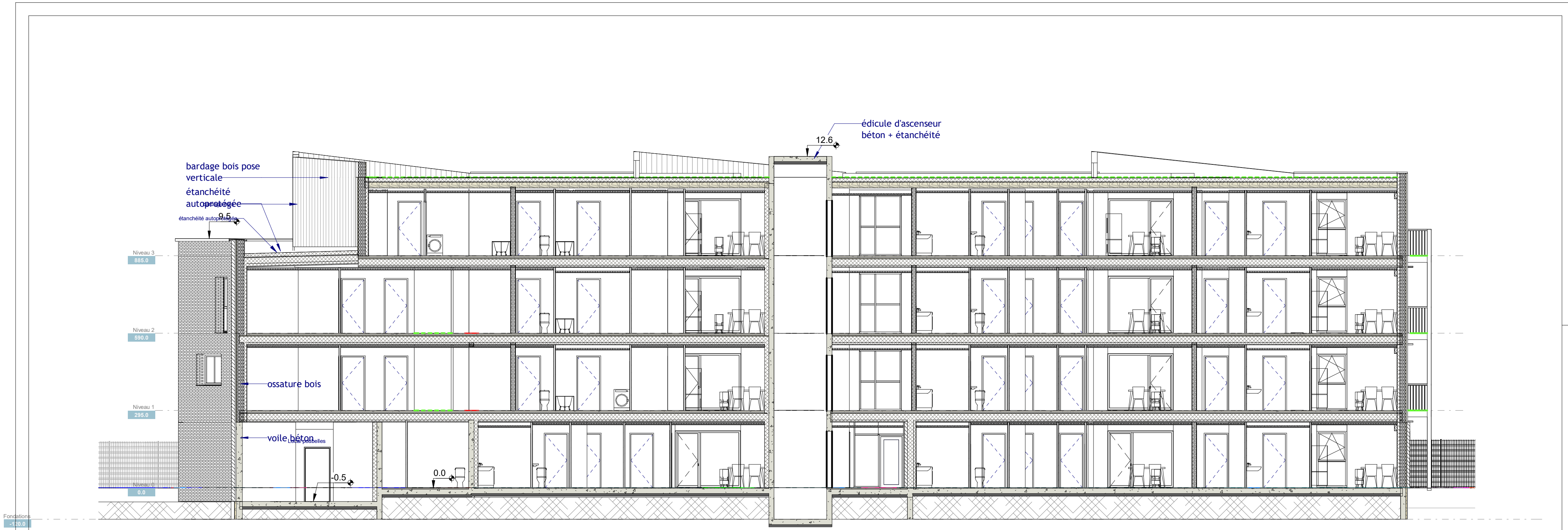
Coupe longitudinale Ech: 1 : 100