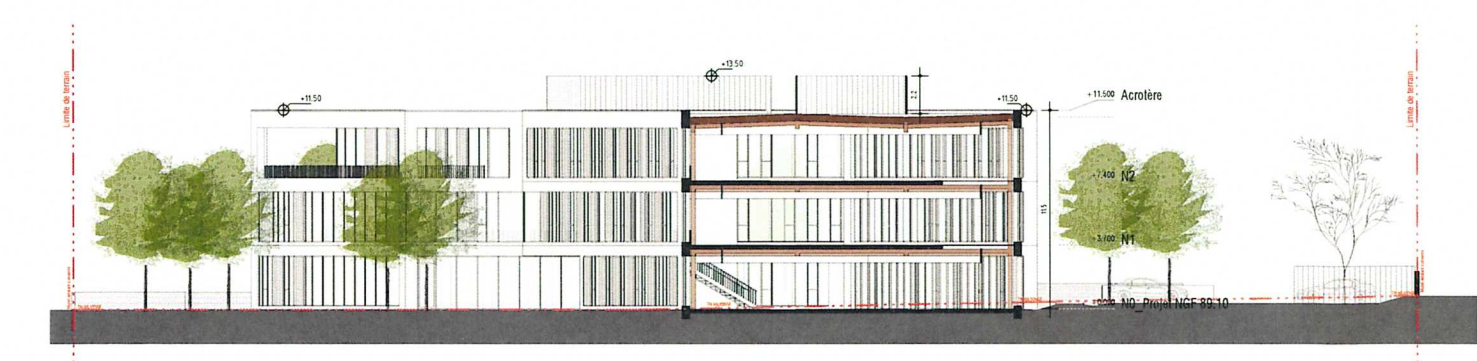
1 | AA 1 : 200