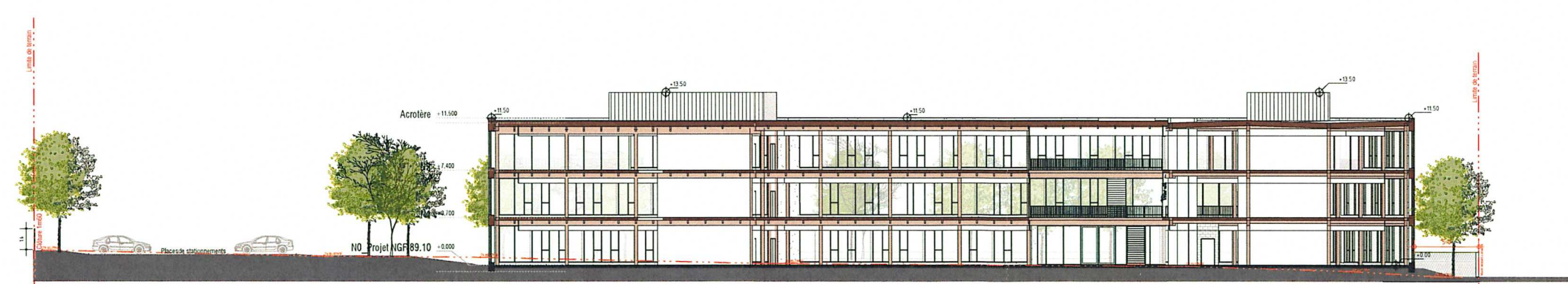
2 | BB 1 : 200

Vu pour être Approuvé à mon avis en date du : 29 MAR. 2021 DÉPARTEMENT DE L'AISNE Maire de Saint-Quentin