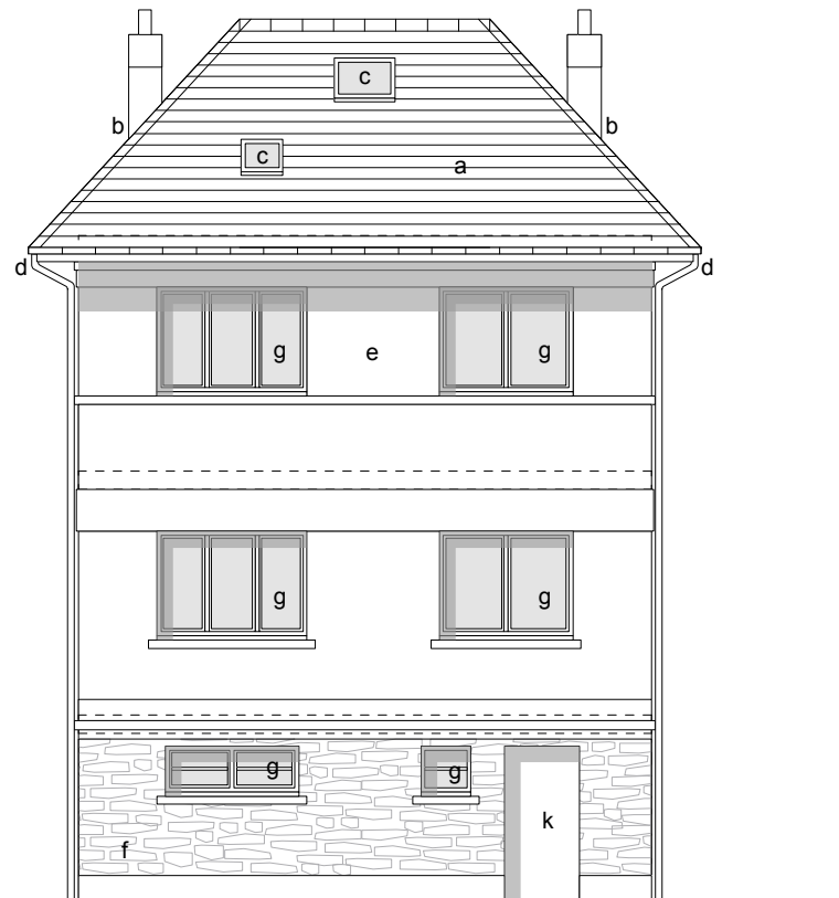
FACADE SUD JARDIN