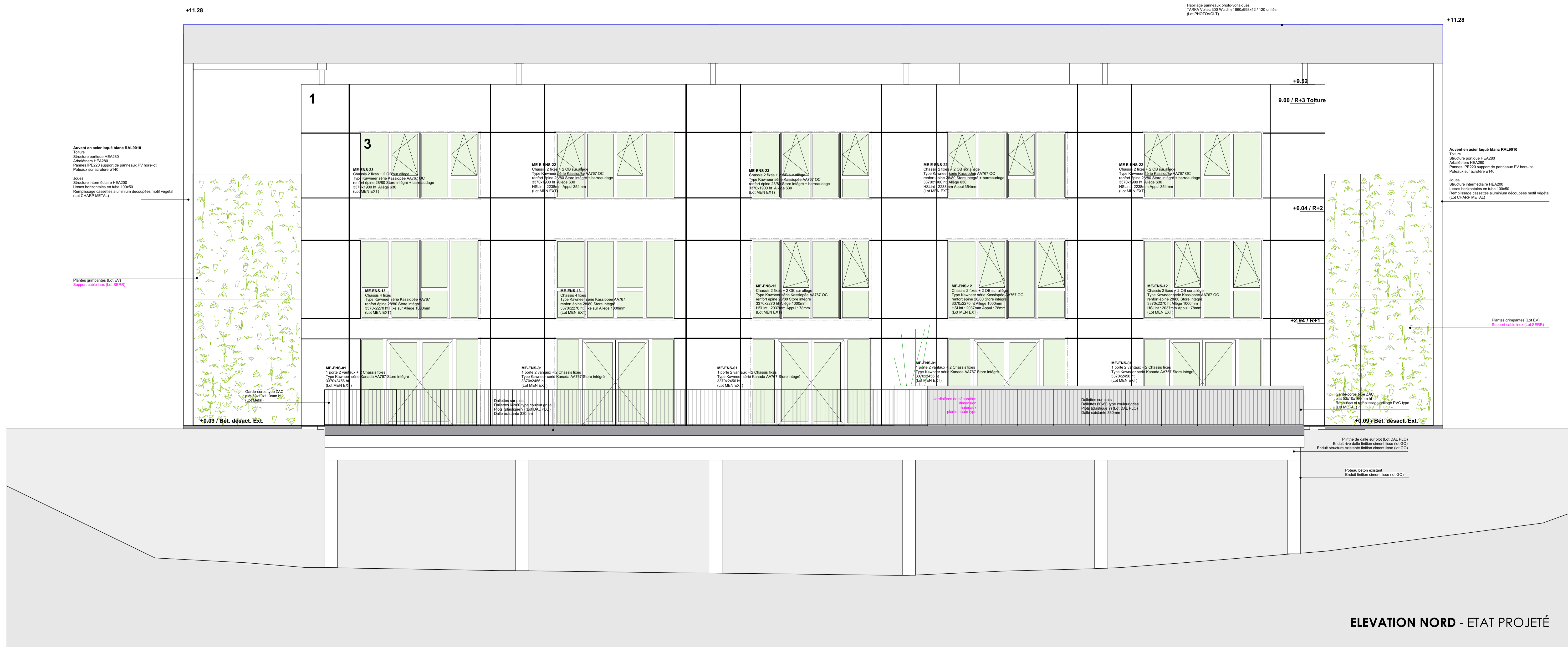
ELEVATION NORD - ETAT PROJÉTÉ