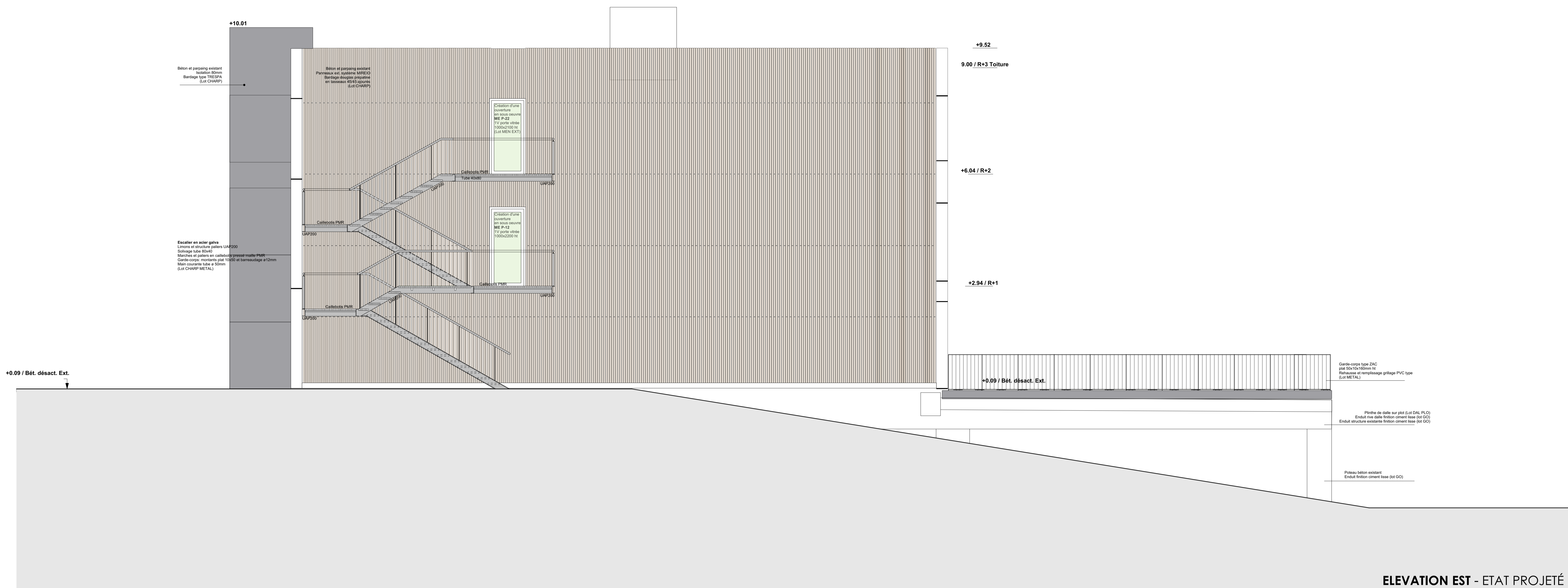
ELEVATION EST - ETAT PROJÉTÉ