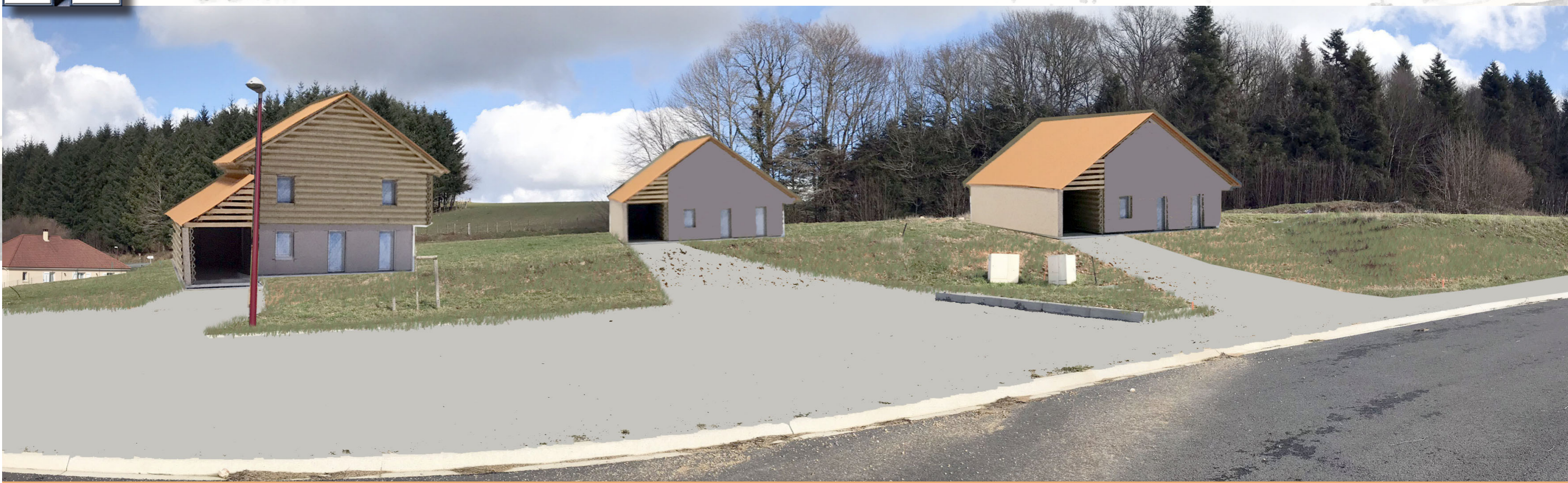
IMAGE DU PROJET - 3 Logements - Lots 7 & 8