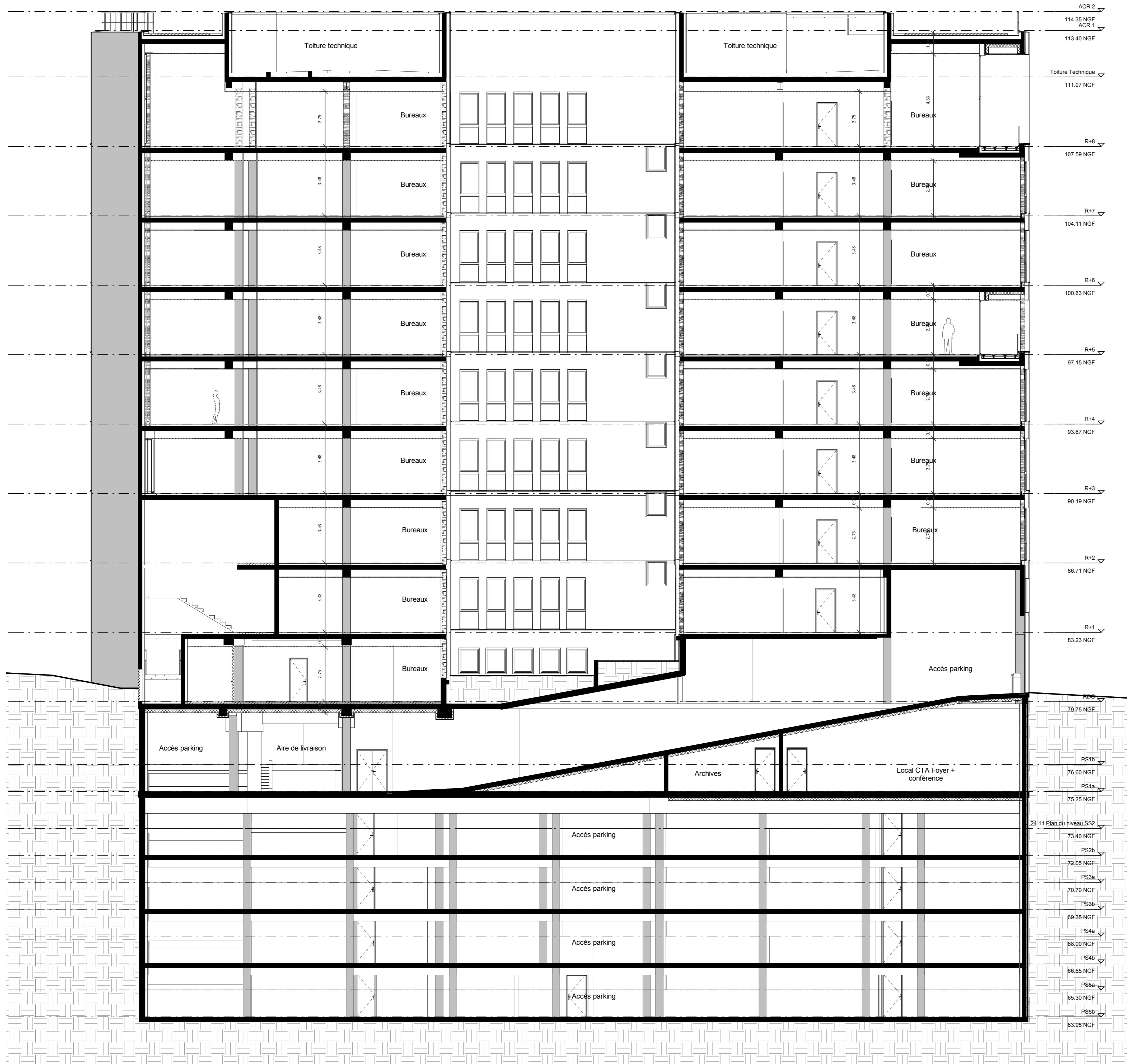
PLAN DE REPERAGE