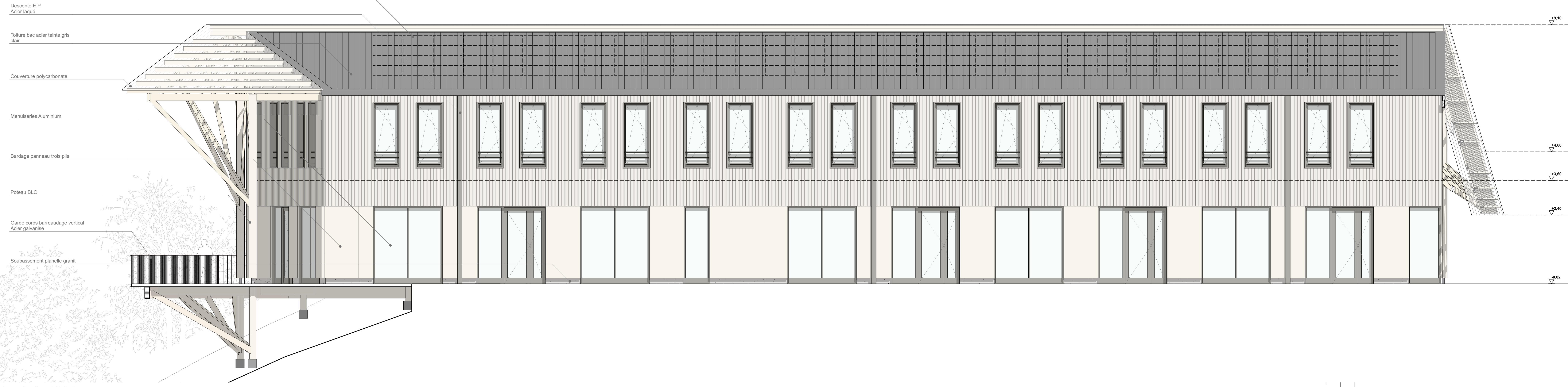
Façade Sud Bâtiment