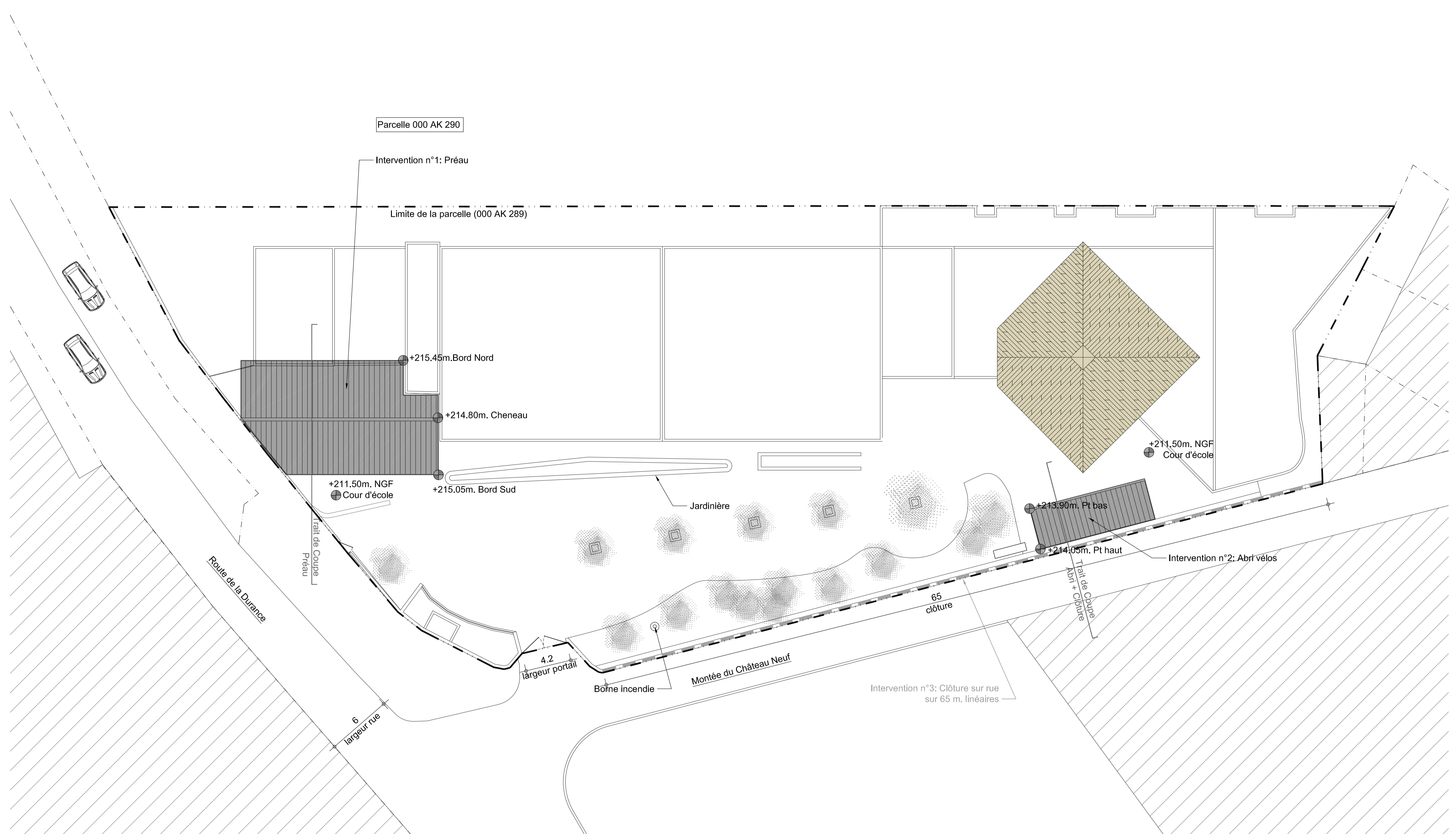
02 Plan Masse PROJET 1:200