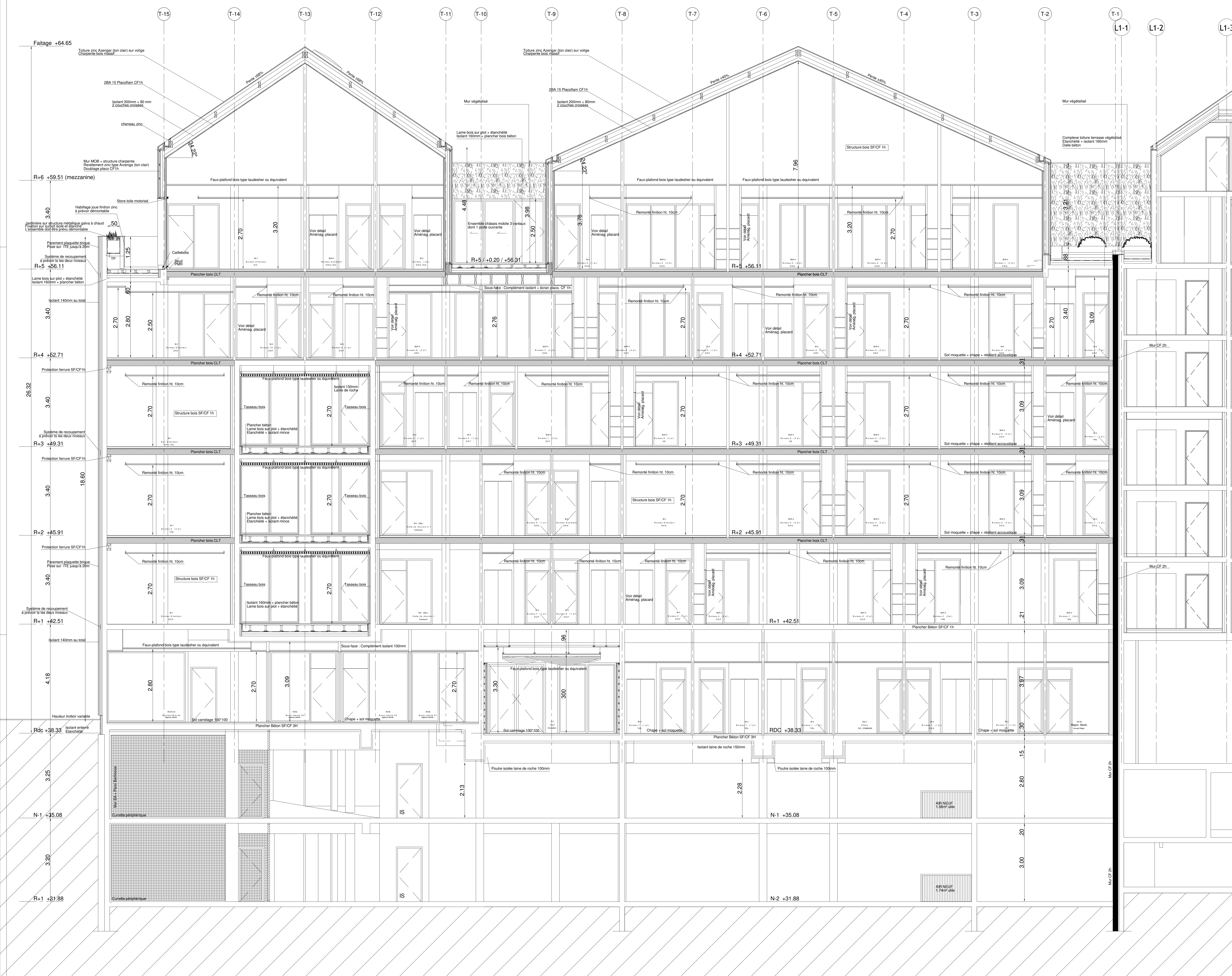
Coupe A - A