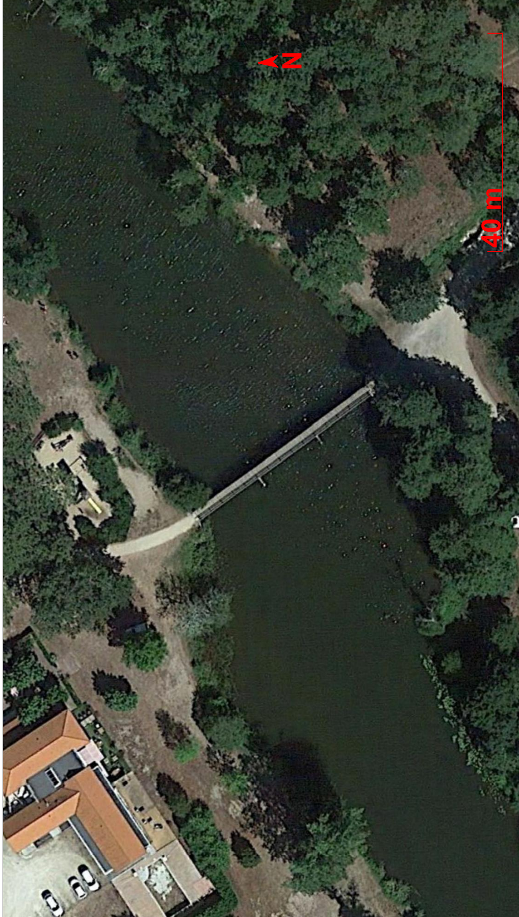
VUE EN PLAN

OREGON 73, bd de Brandebourg 94200 Kryssur-Sainte Email : oregon@bet-oregon.com tel : 01 43 62 51 83 fax : 06 25 38 41 76