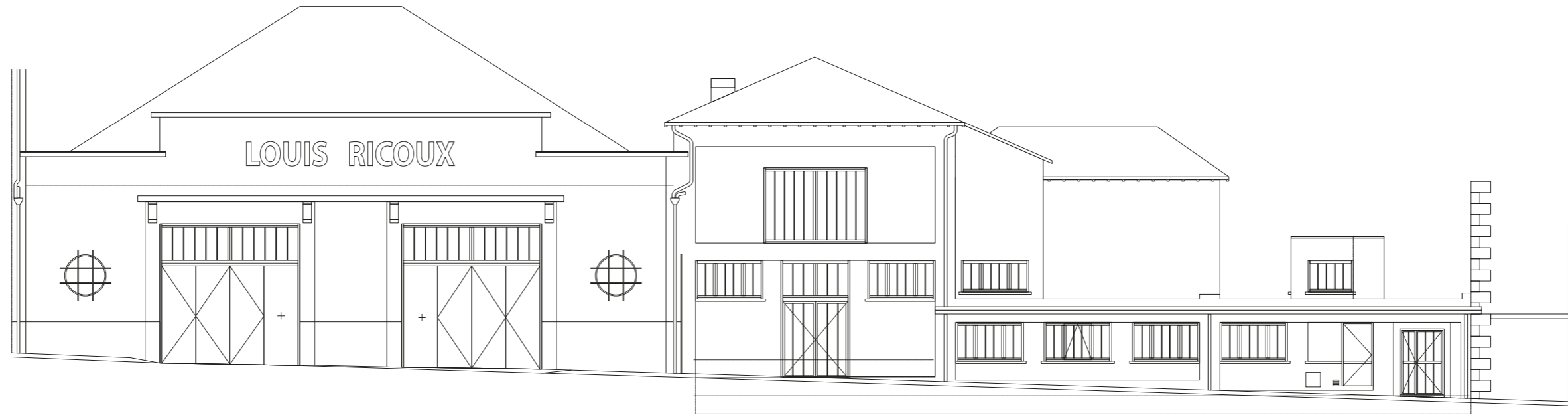
Façade OUEST (sur rue)