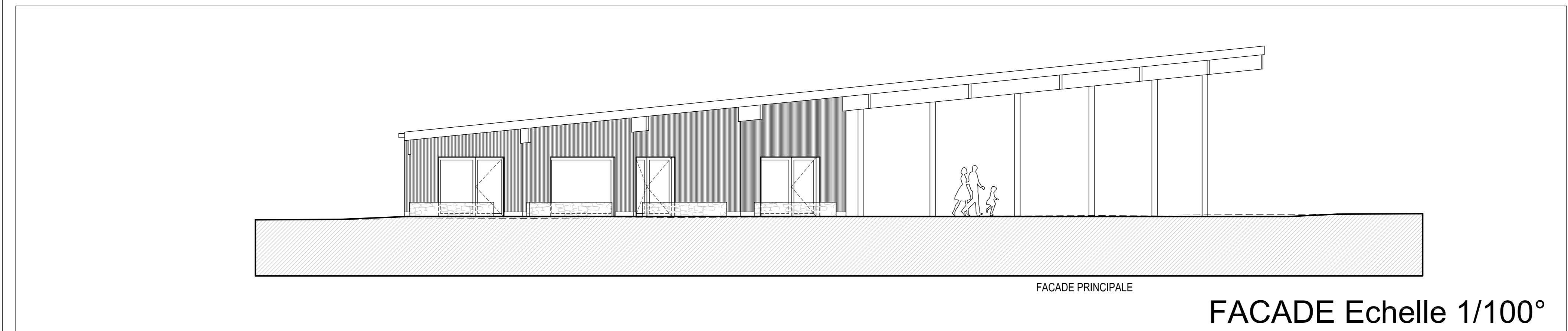
FACADE Echelle 1/100°