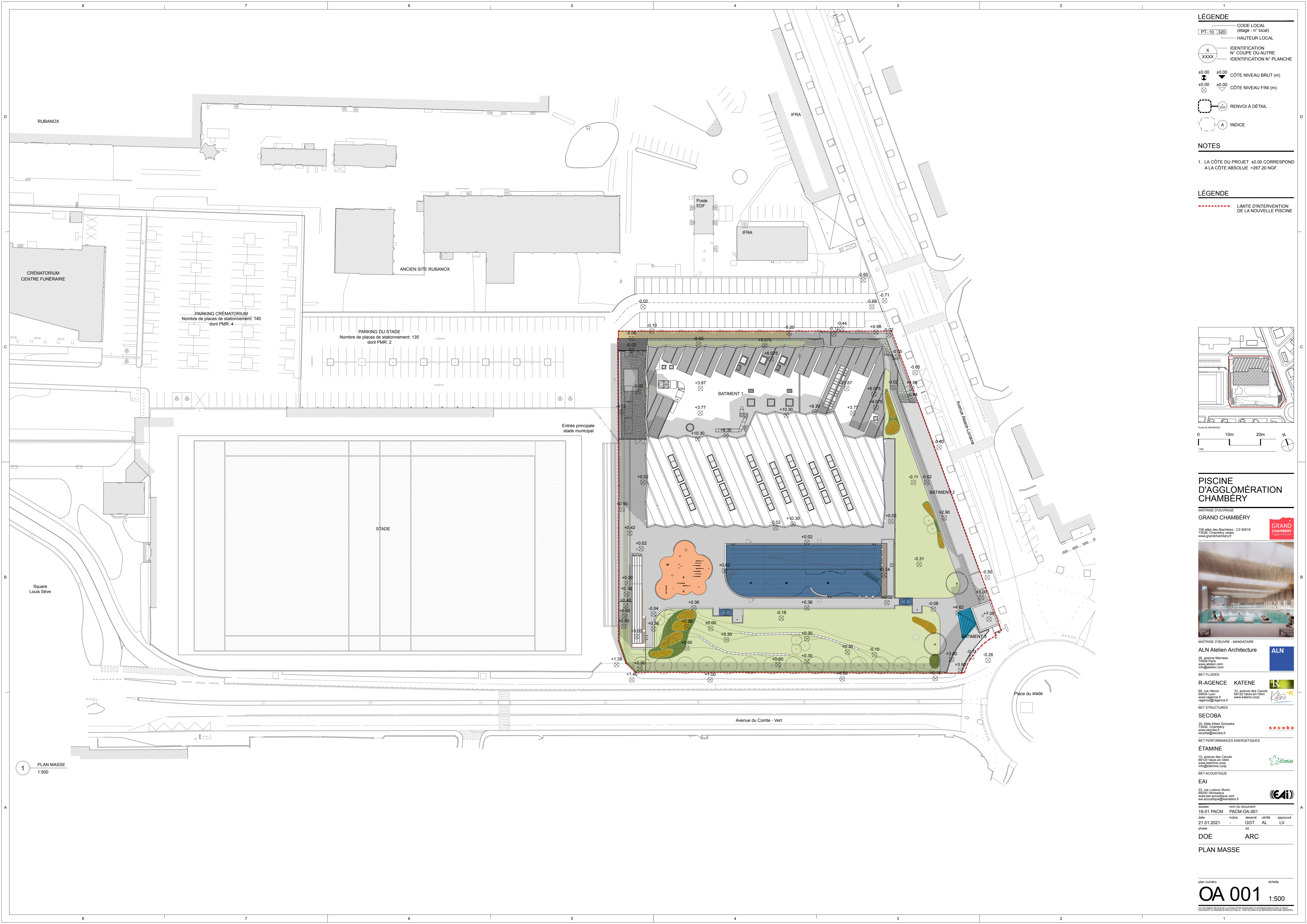
1 PLAN MASSE 1:500