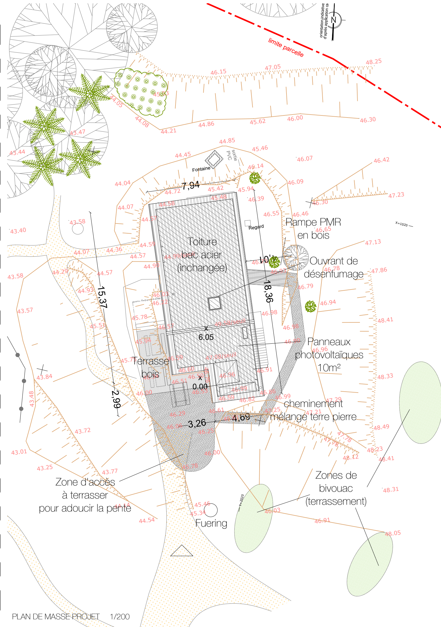
PLAN DE MASSE PROJET 1/200