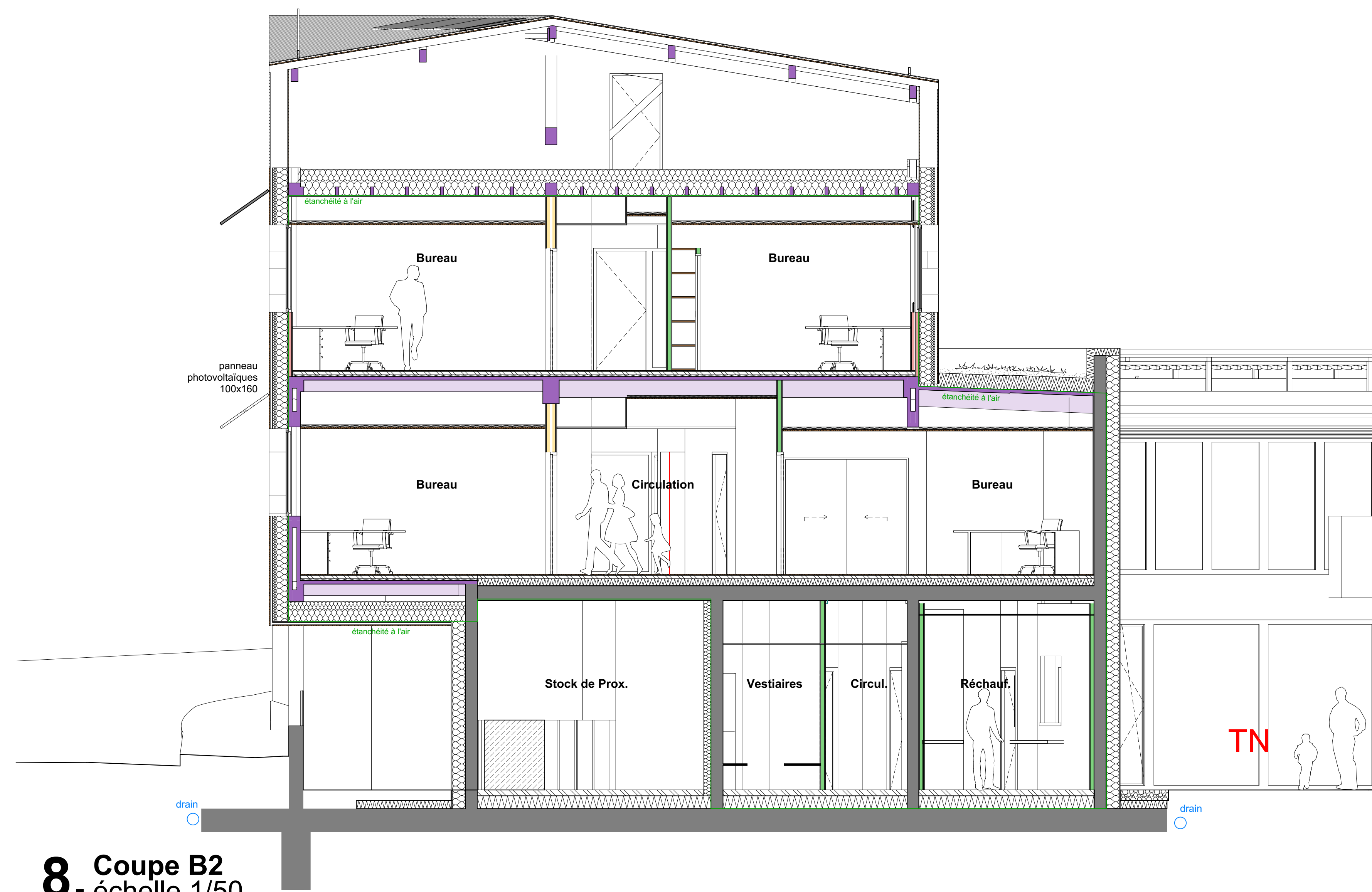
8. Coupe B2 échelle 1/50

14-05 / Construction du siège de la CCOI