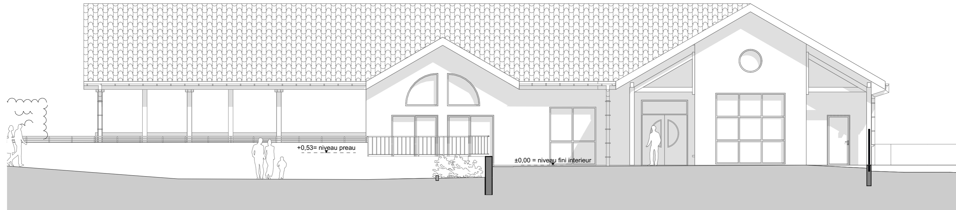
ETAT DES LIEUX