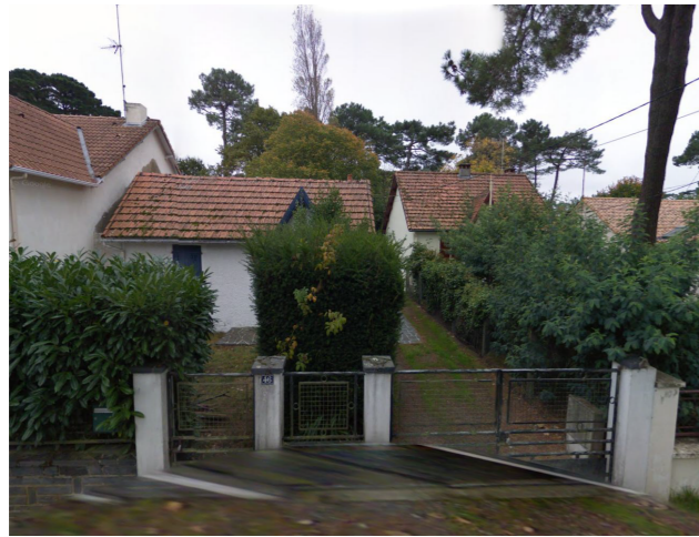
PHOTO PAYSAGE PROCHE - PCMI 7