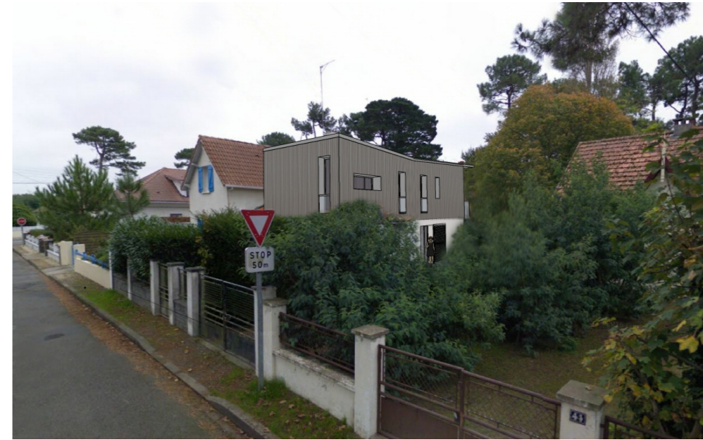
DOCUMENT GRAPHIQUE D'INSERTION - PCMI 6