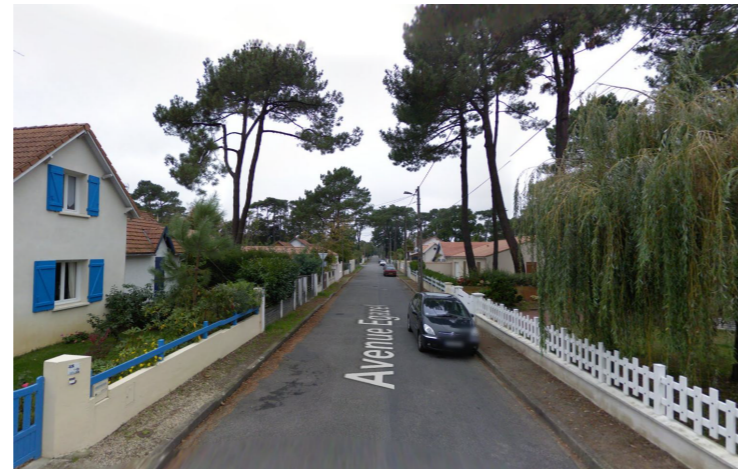
PHOTO PAYSAGE LOINTAIN - PCMI 8