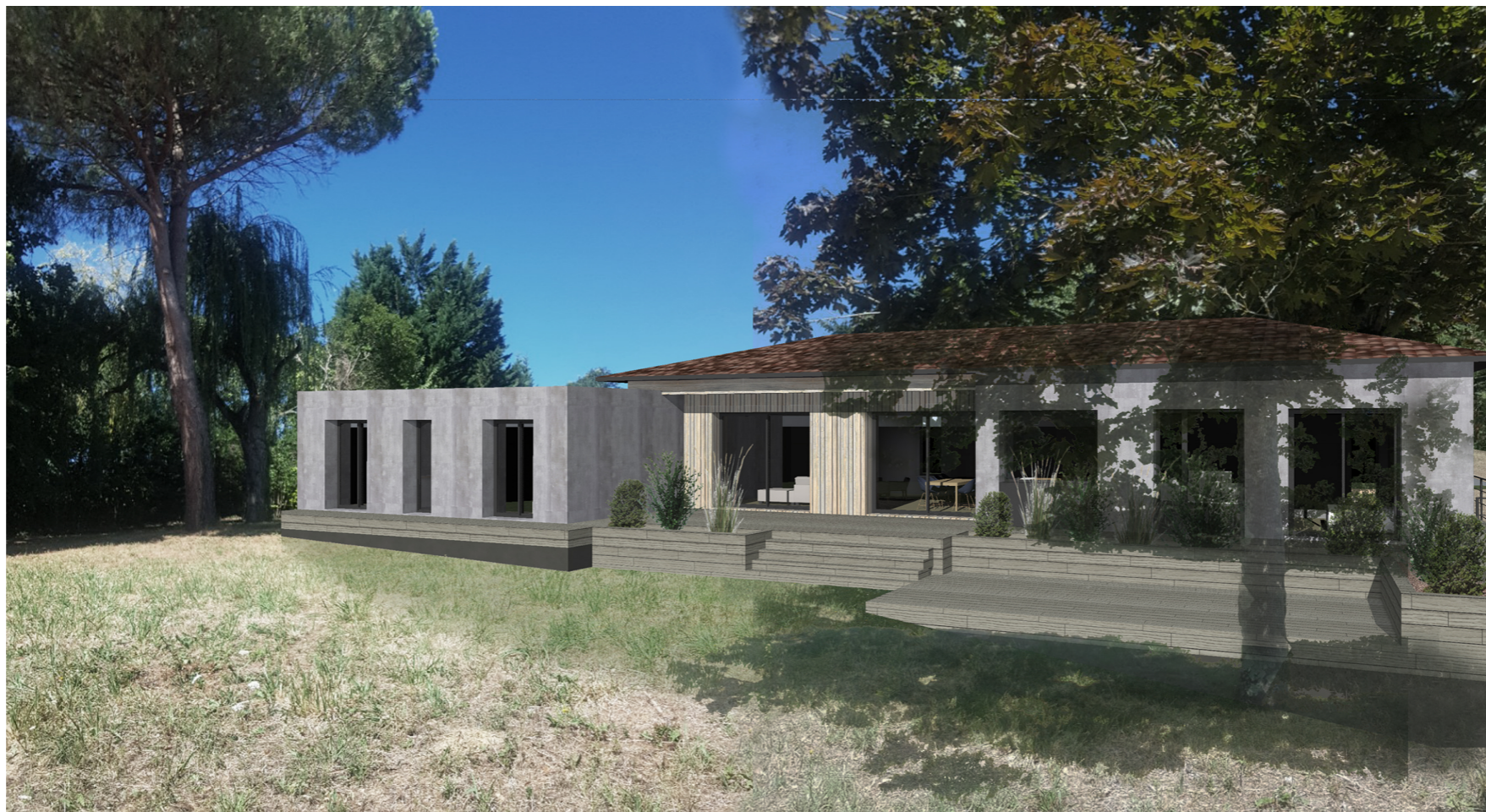
PCMI6 Insertion dans l'environnement