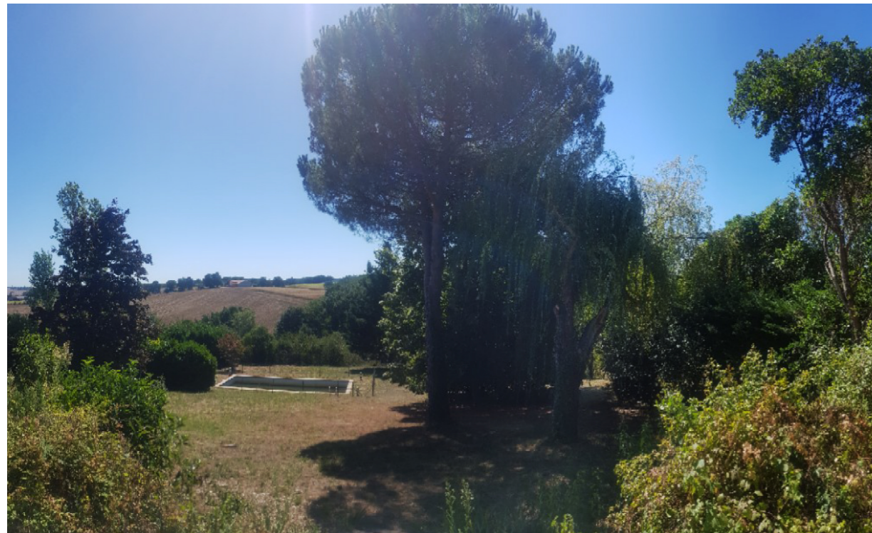
PCMI7 Photographie de l'environnement proche