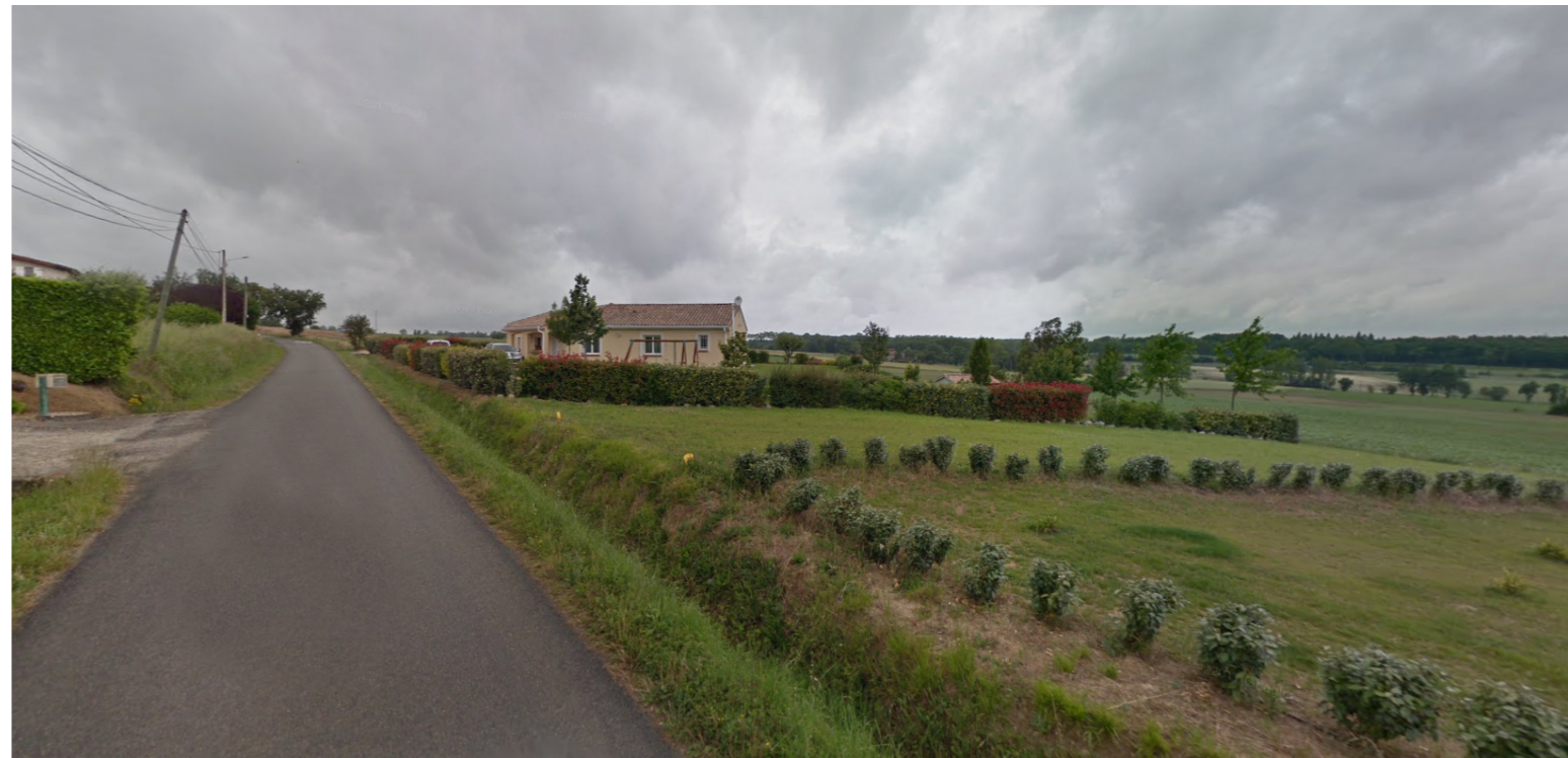
PCMI8 Photographie du paysage lointain