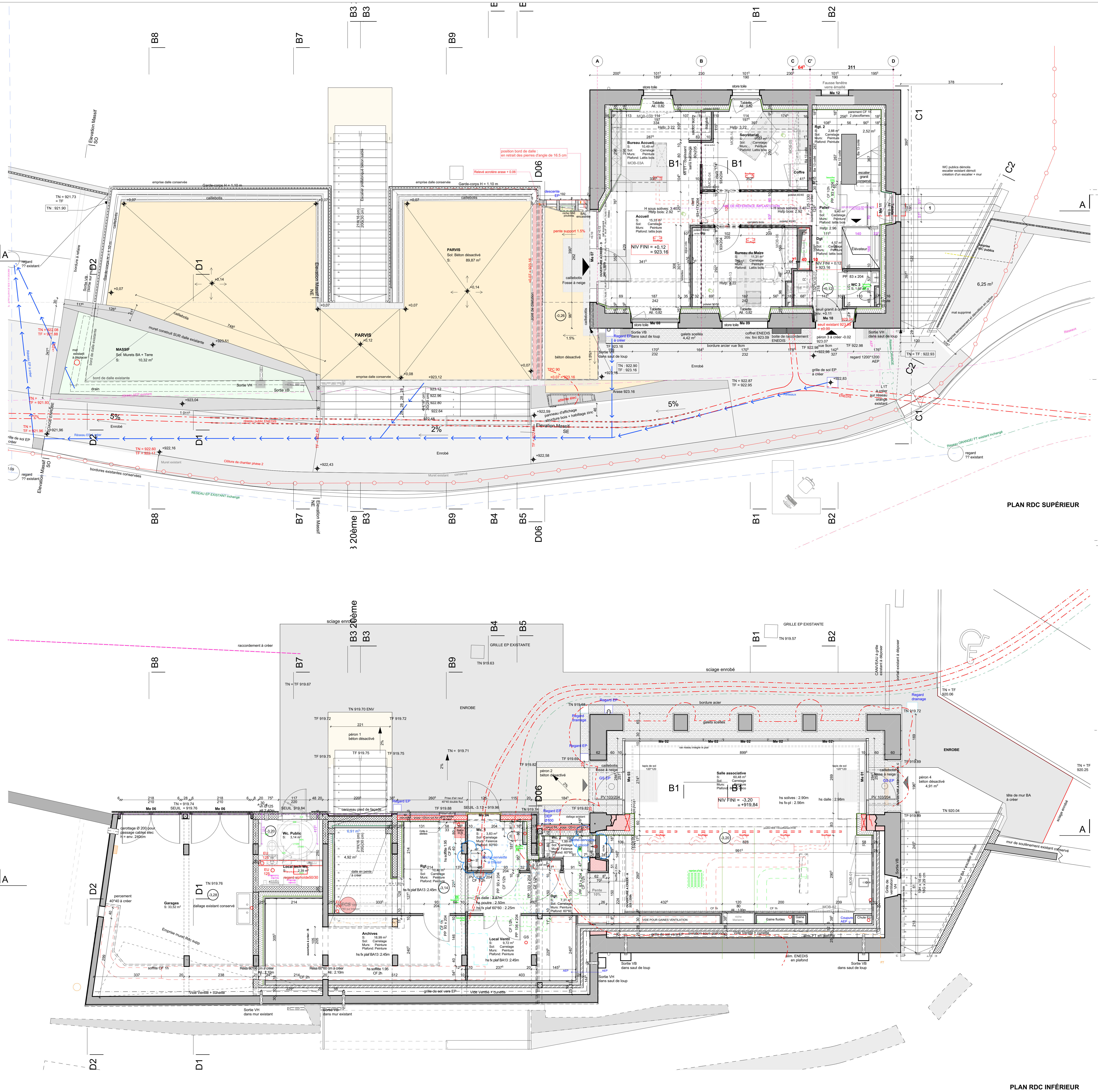
PLAN RDC SUPERIEUR