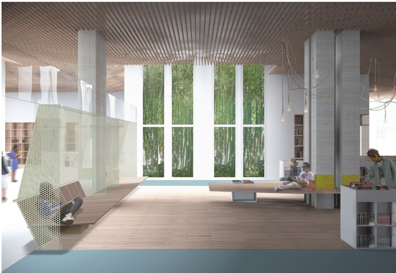
2 - VUE SUR L'ESPACE BD ET LA ZONE DE DÉTENTE (arrière plan : le patio des logements)