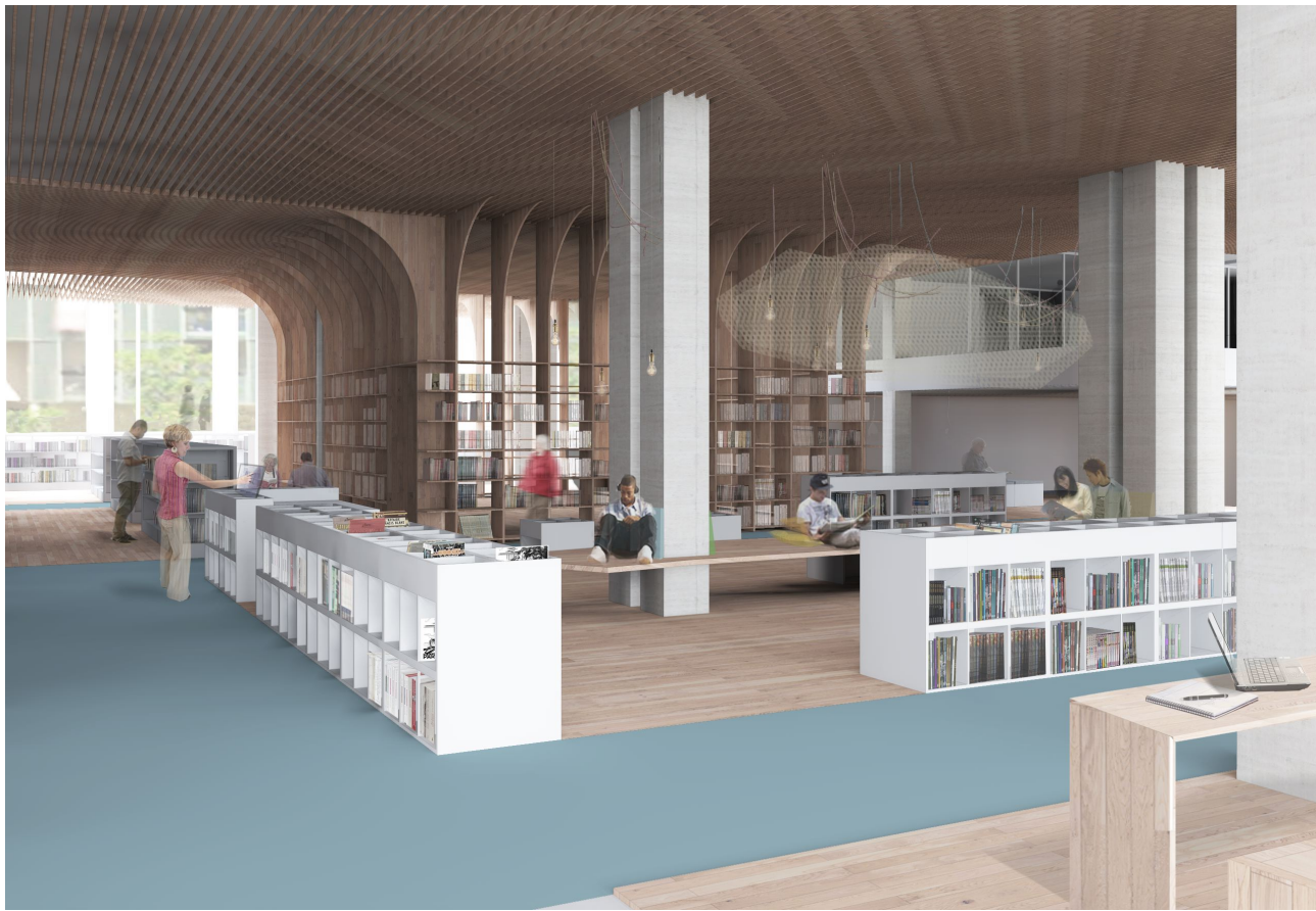
3 - VUE SUR L'ESPACE BD, MUSIQUE ET IMAGE (arrière plan : la salle de consultation studieuse)