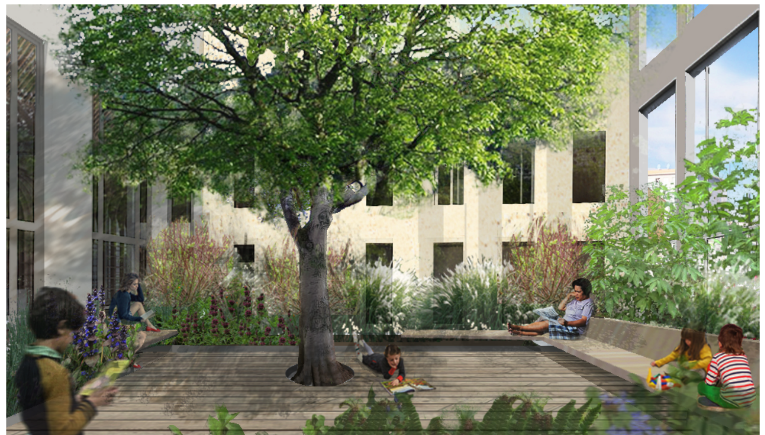
1 - PERSPECTIVE SUR LE PATIO ET SON DECK BOIS (plantations non accessibles)