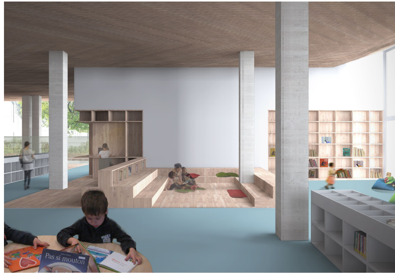
4 - VUE SUR L'ESPACE ENFANTS