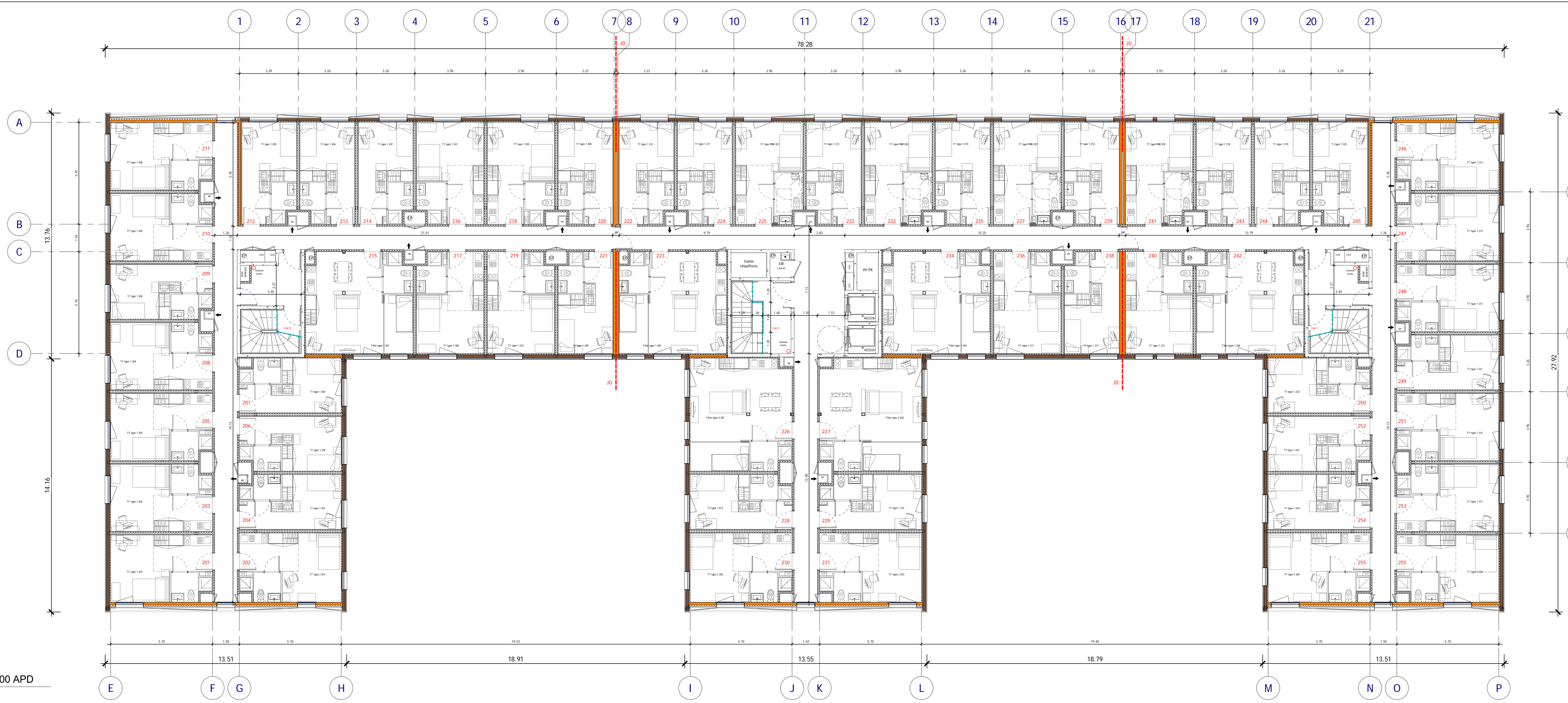
2 Niveau 2 - 1/100 APD 1 : 100