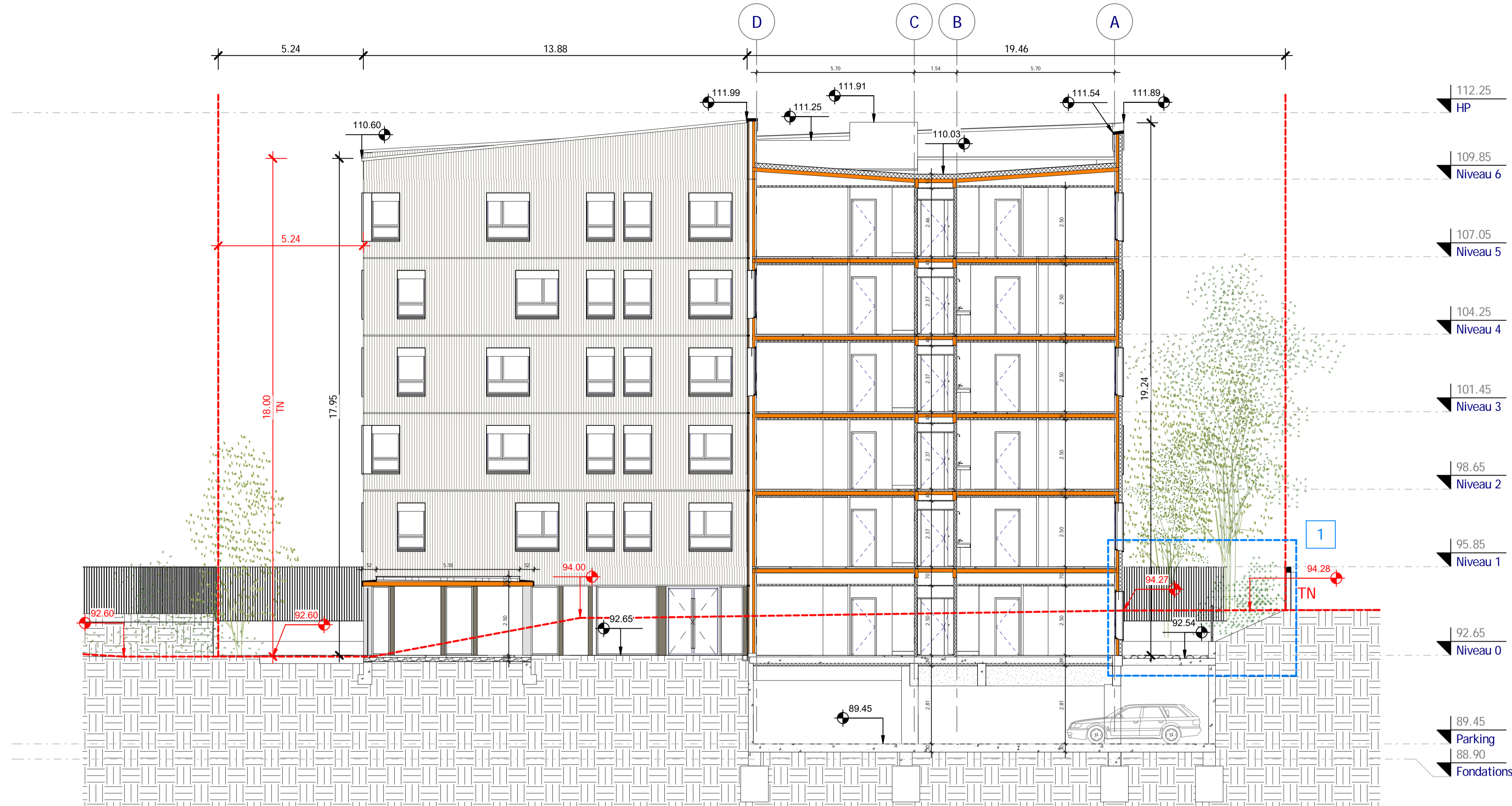
2 Coupe transversale DD' 1/100 PRO 1 : 100