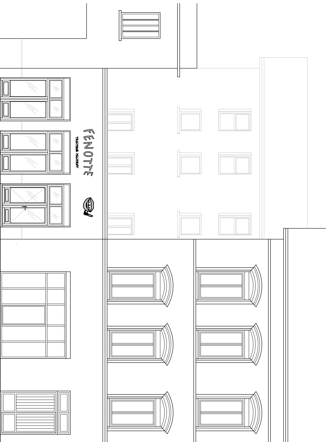
ELEVATION EST - PROJET - 1/100e (SUR QUAI ARLOING)