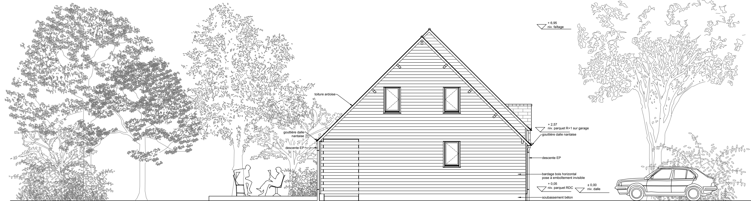
FACADE SE EXISTANT 1/100