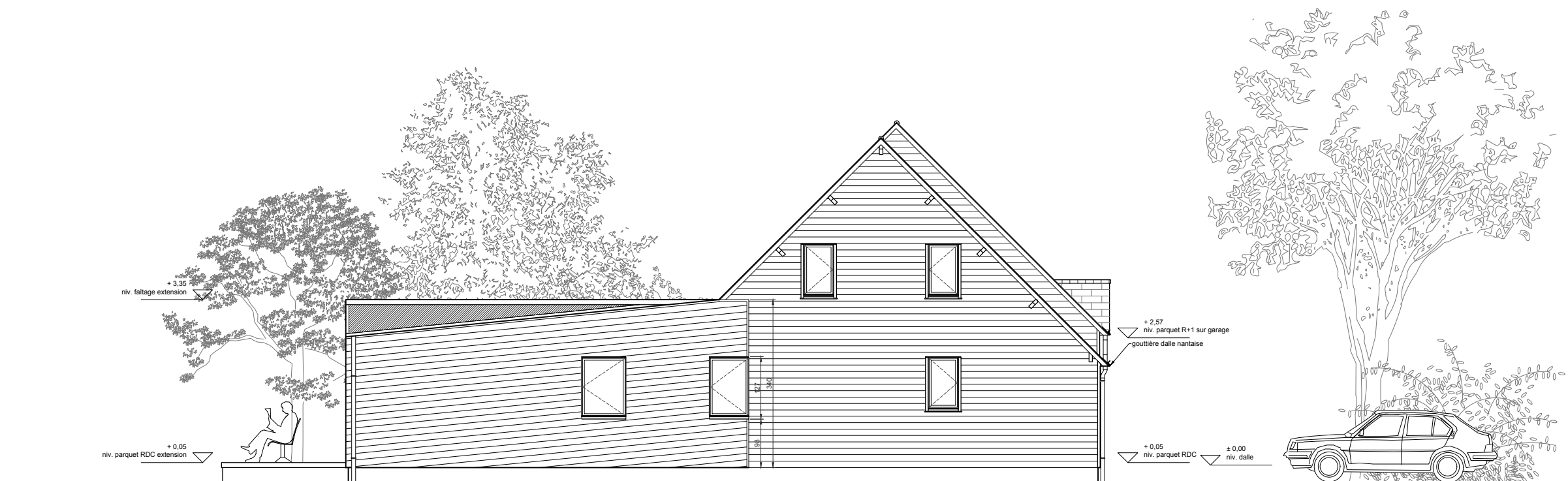
FACADE SE PROJET 1/100

PLANS D'ESQUISSE - ces plans ne sont pas des plans d'exécution : des études supplémentaires sont nécessaires toutes les cotes sont à vérifier sur place et à adapter en conséquence tous les matériaux entrant dans la construction de l'ouvrage, leur mise en oeuvre, les essais et modes de réception seront conformes aux recueils des D.T.U. et Normes Françaises