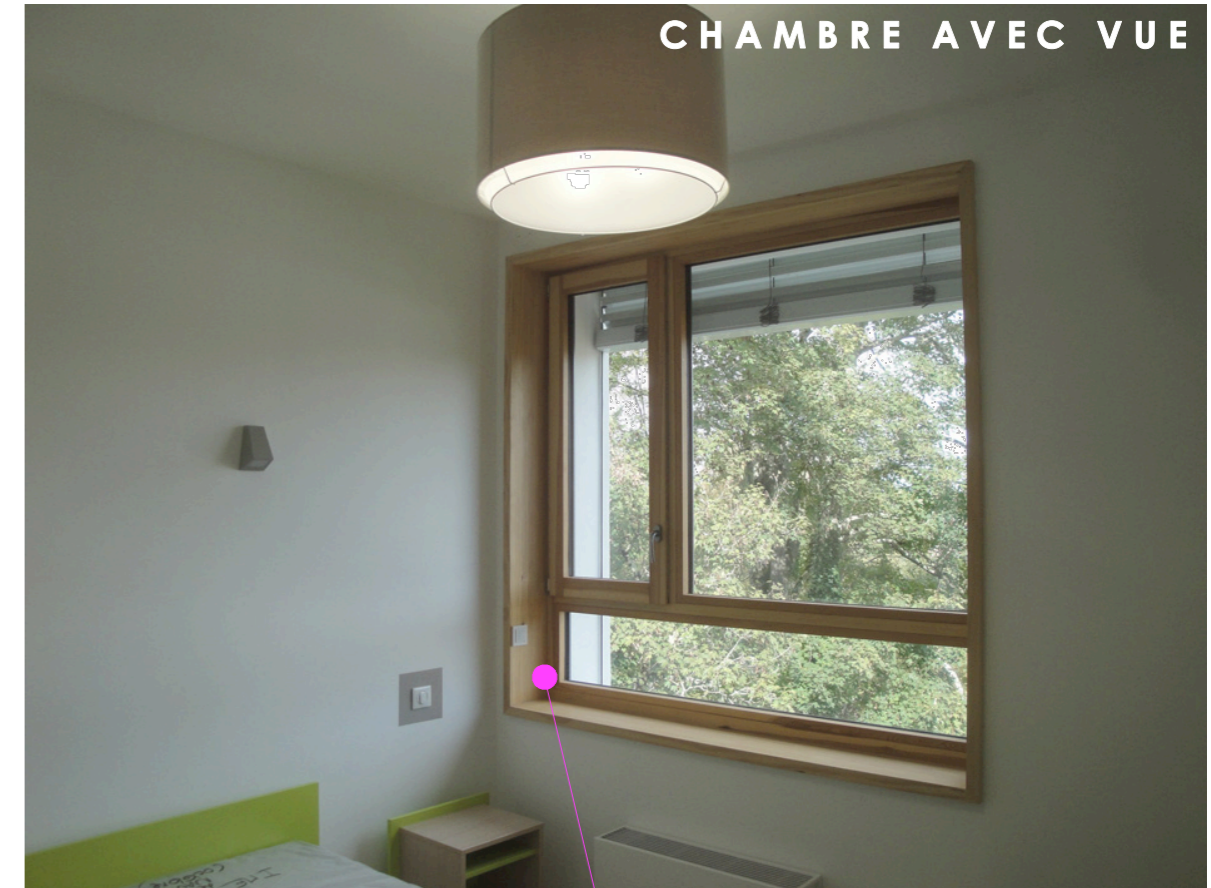
CHAMBRE AVEC VUE