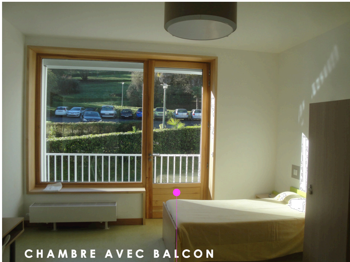
CHAMBRE AVEC BALCON