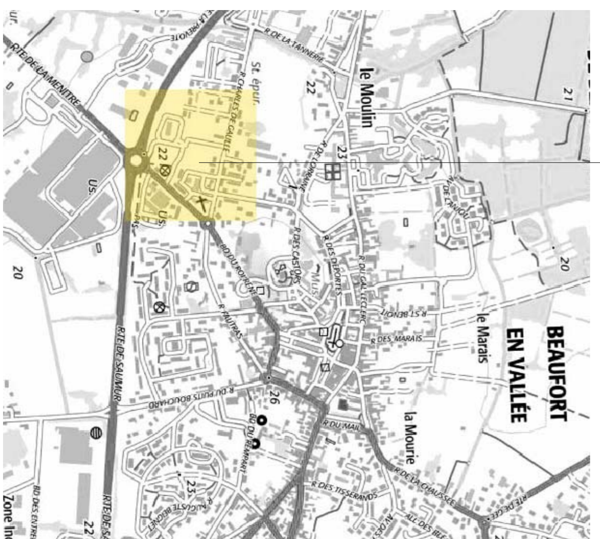
IGN - 1/32000

N ZAC de la Poissonnière 49250 Beauport-en-Anjou