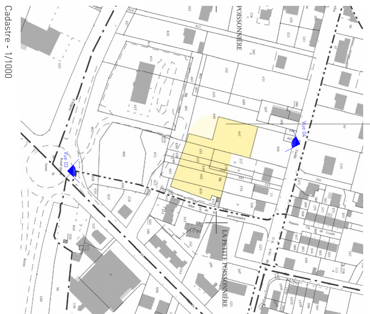
Cadastrre - 1/1000

N Section AV Parcelles : 435, 437, 439, 442, 447, 456, 217 parcelle, 236 parcelle & 239 parcelle Surface: 3172 m 2