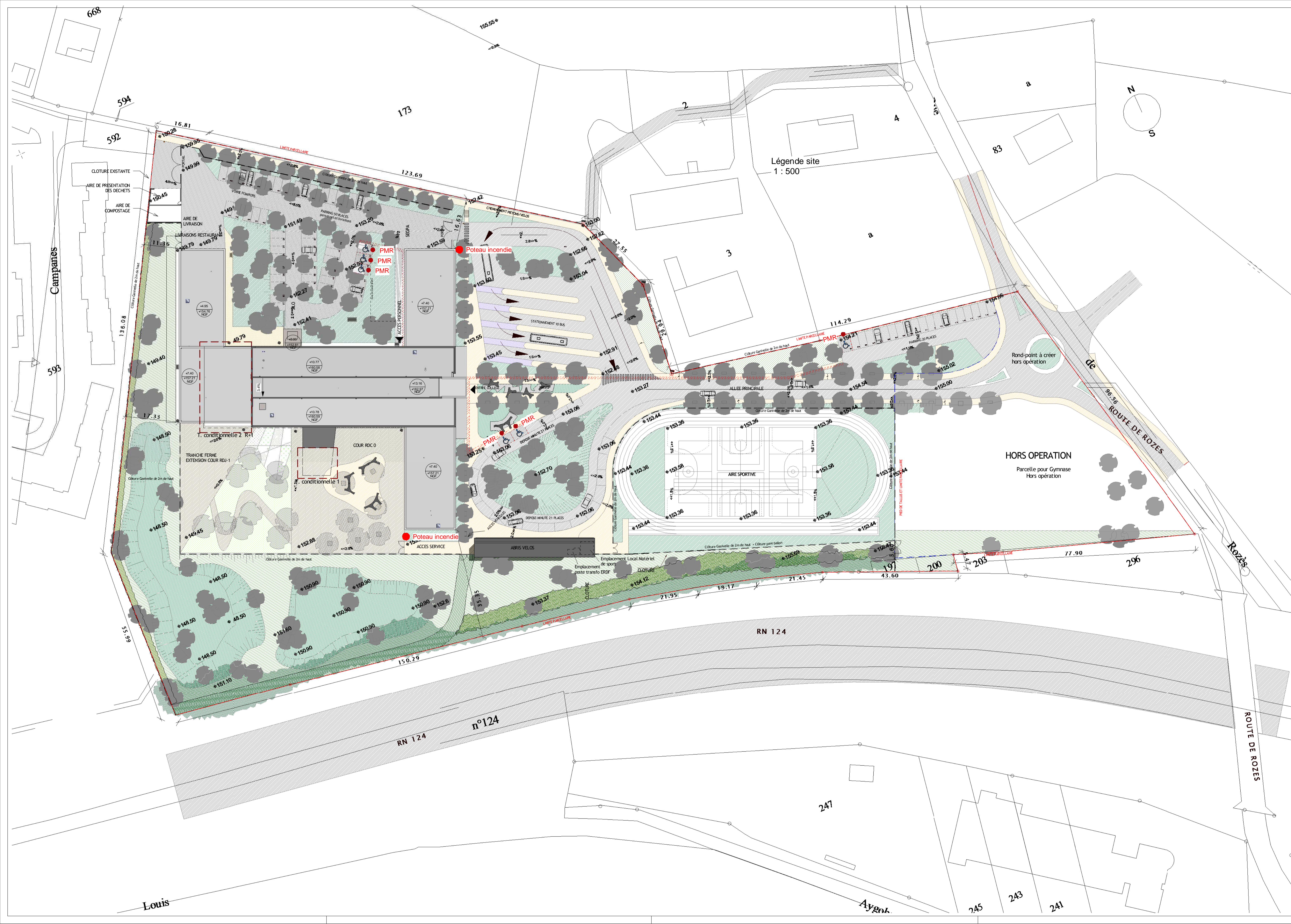
Légende site 1 : 500