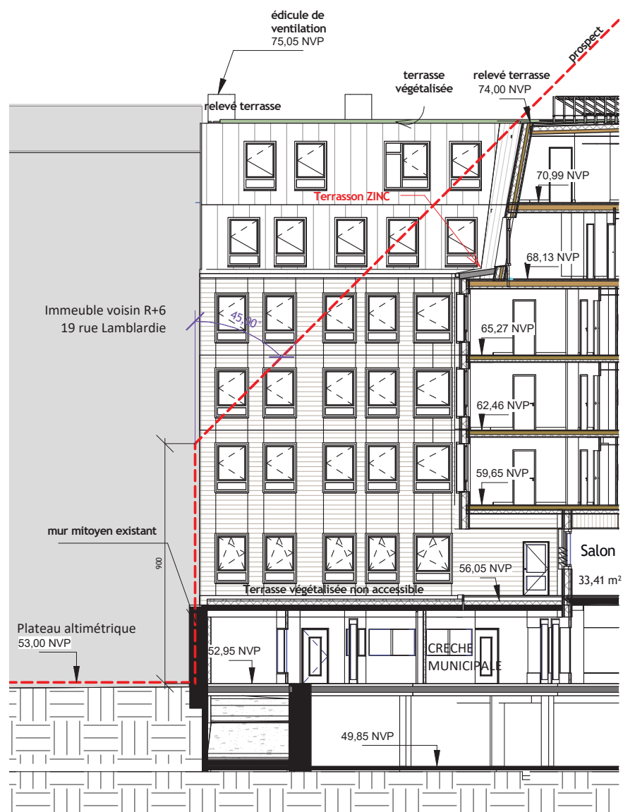
1 PCM2 Prospect immeuble voisin R+6 1 : 200