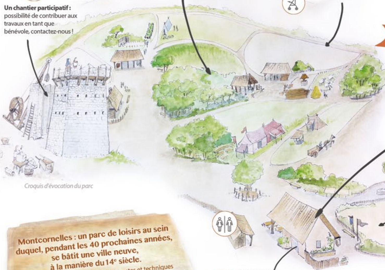
Croquis d'évocation du parc

Montcornelles : un parc de loisirs au sein duquel, pendant les 40 prochaines années, se bâtit une ville neuve, à la manière du 14 e siècle.