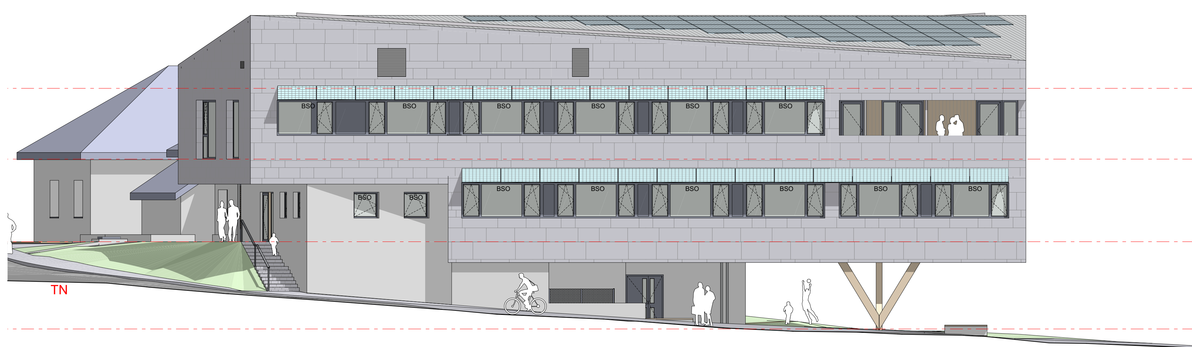
15. Façade Sud échelle 1/100