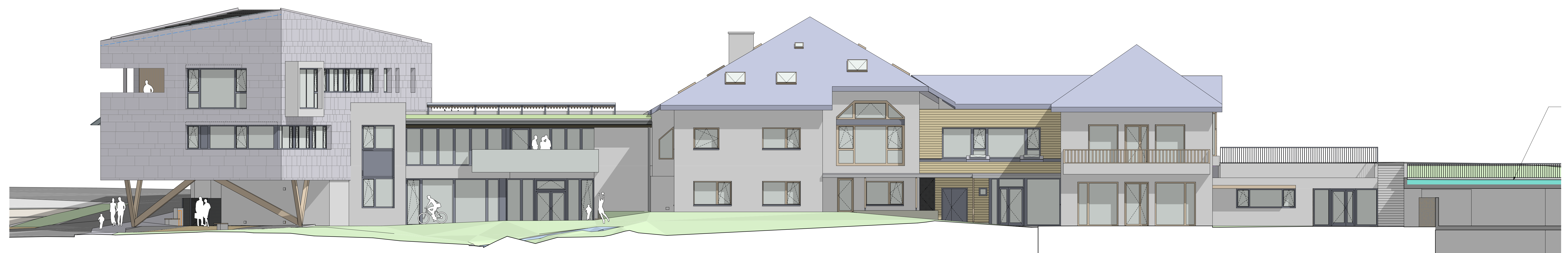
17. Façade Est échelle 1/100

14-05 / Construction du siège de la CCOI 29/03/2018