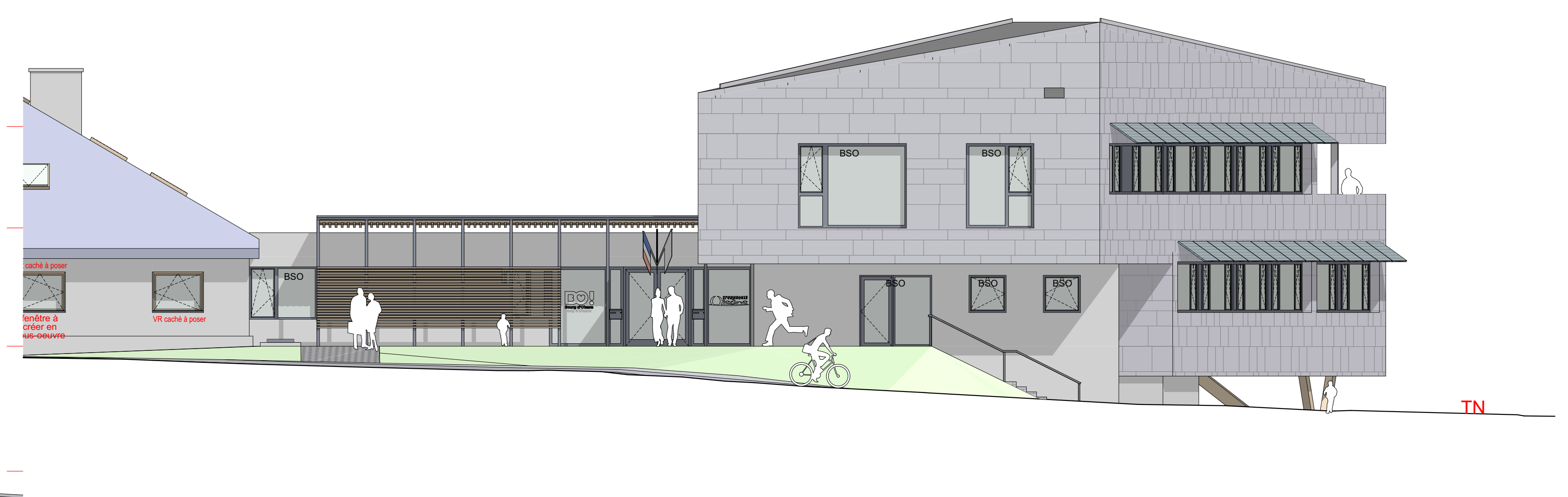
16. Façade Ouest échelle 1/100