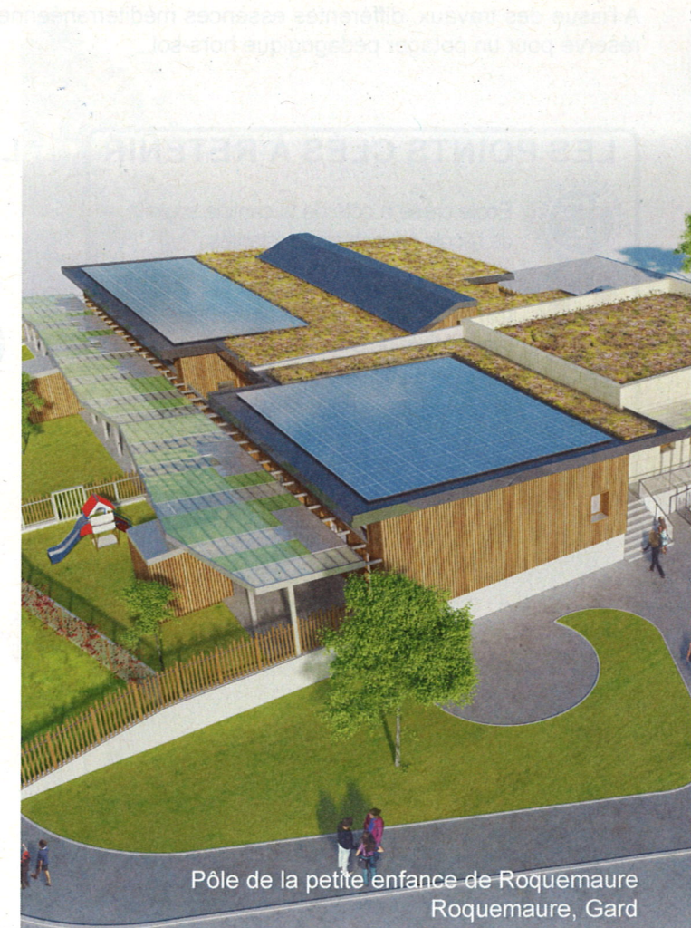
Pôle de la petite enfance de Roquemaure Roquemaure, Gard

Climat : H3 Altitude : 25 m Surface : 915 m 2 Classement : BR1 - CE1 Planning travaux : Début : 05.2016 - Fin : 07.2017