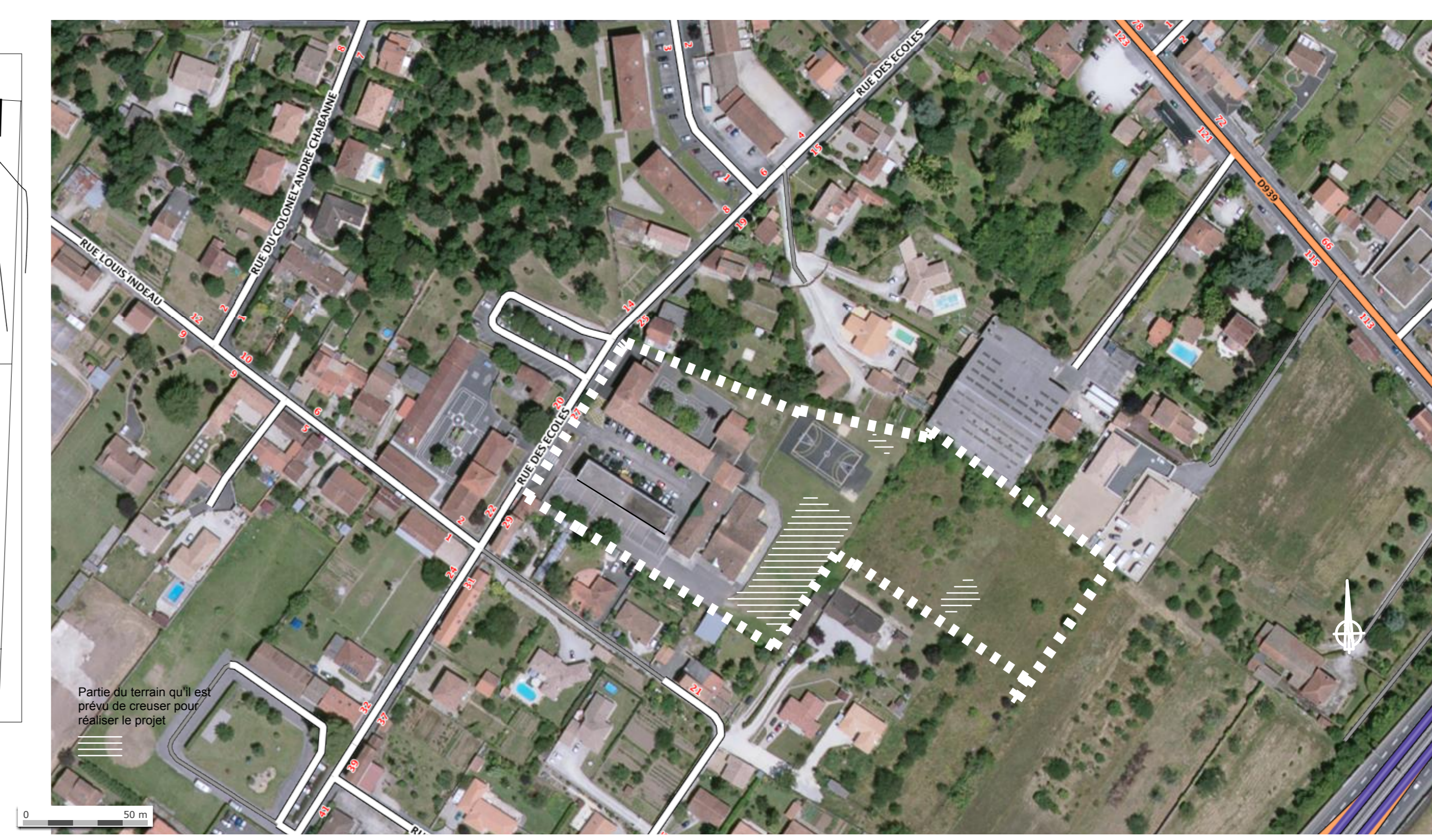
PHOTO AERIEENNE SU SITE