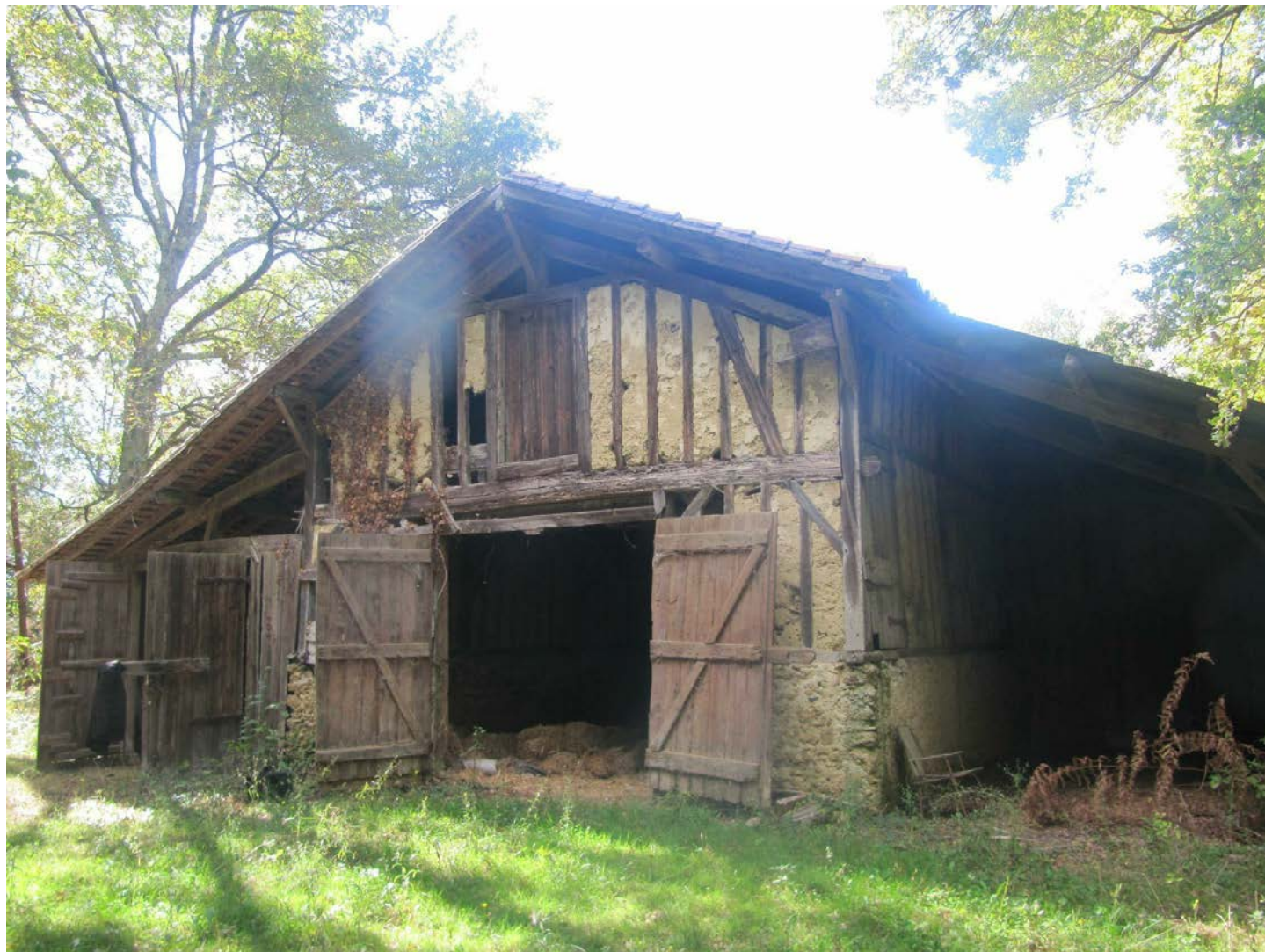
PC MI 7- PHOTOGRAPHIE PROCHE