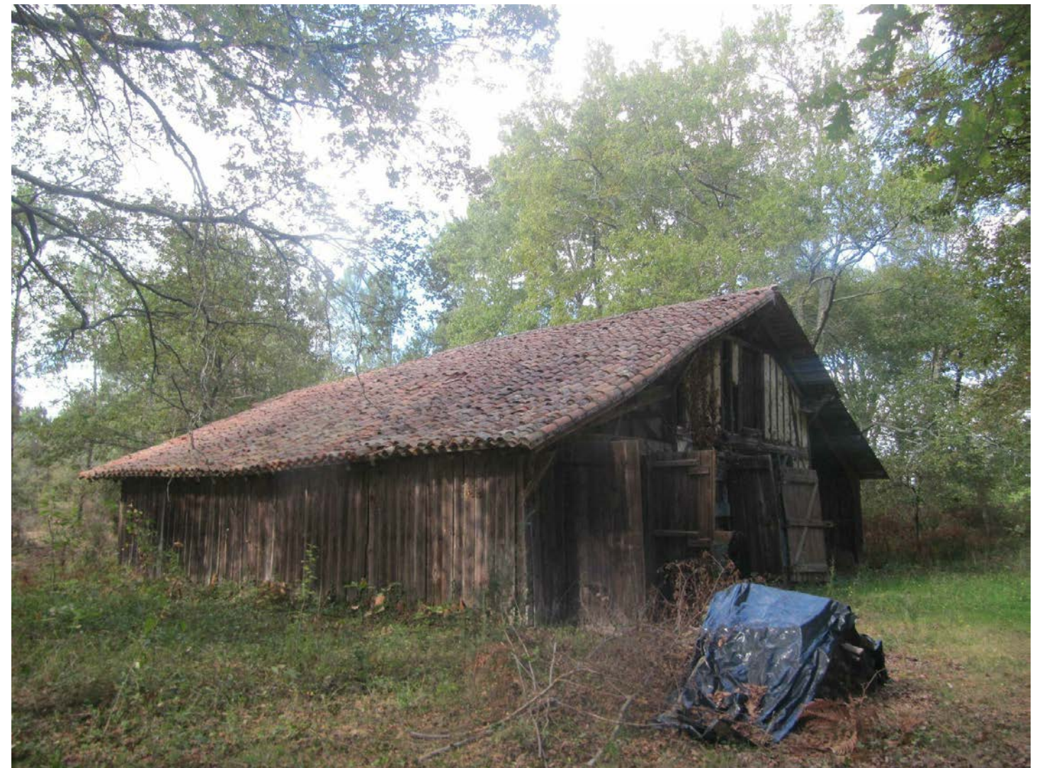
PC MI 8-PHOTOGRAPHIE LOINTAINE