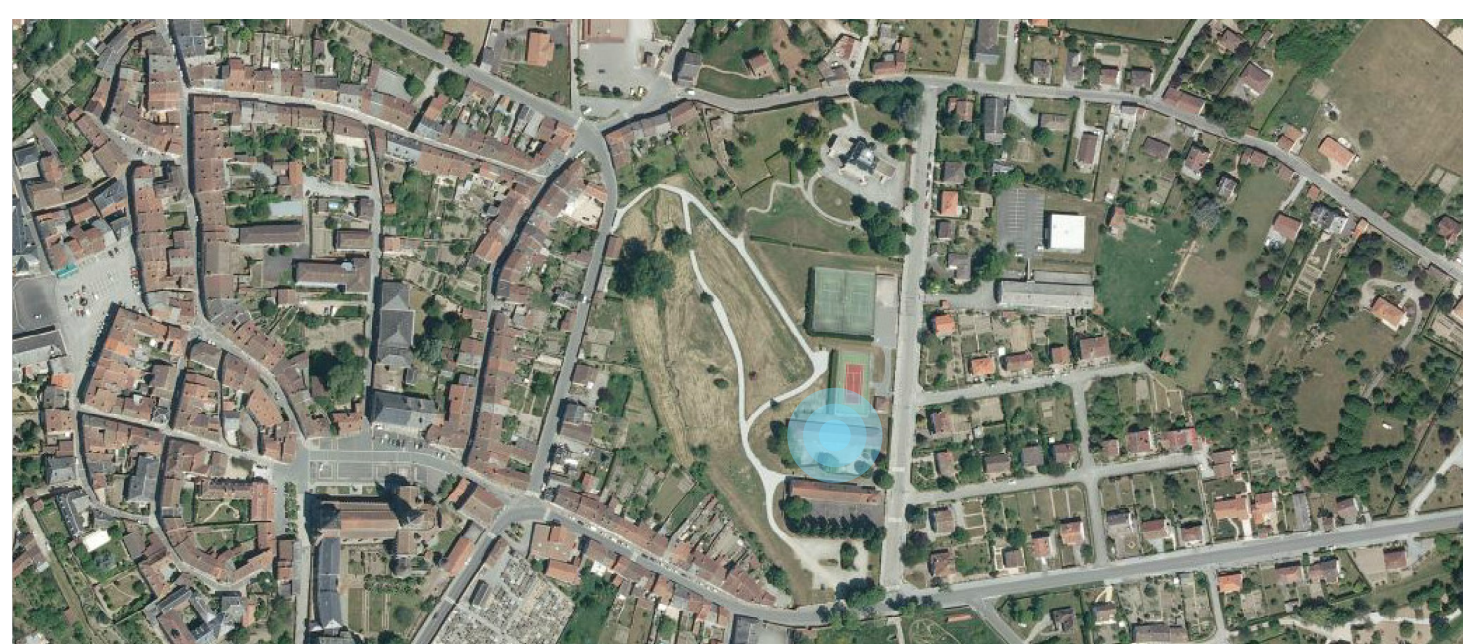
SITUATION DU TERRAIN