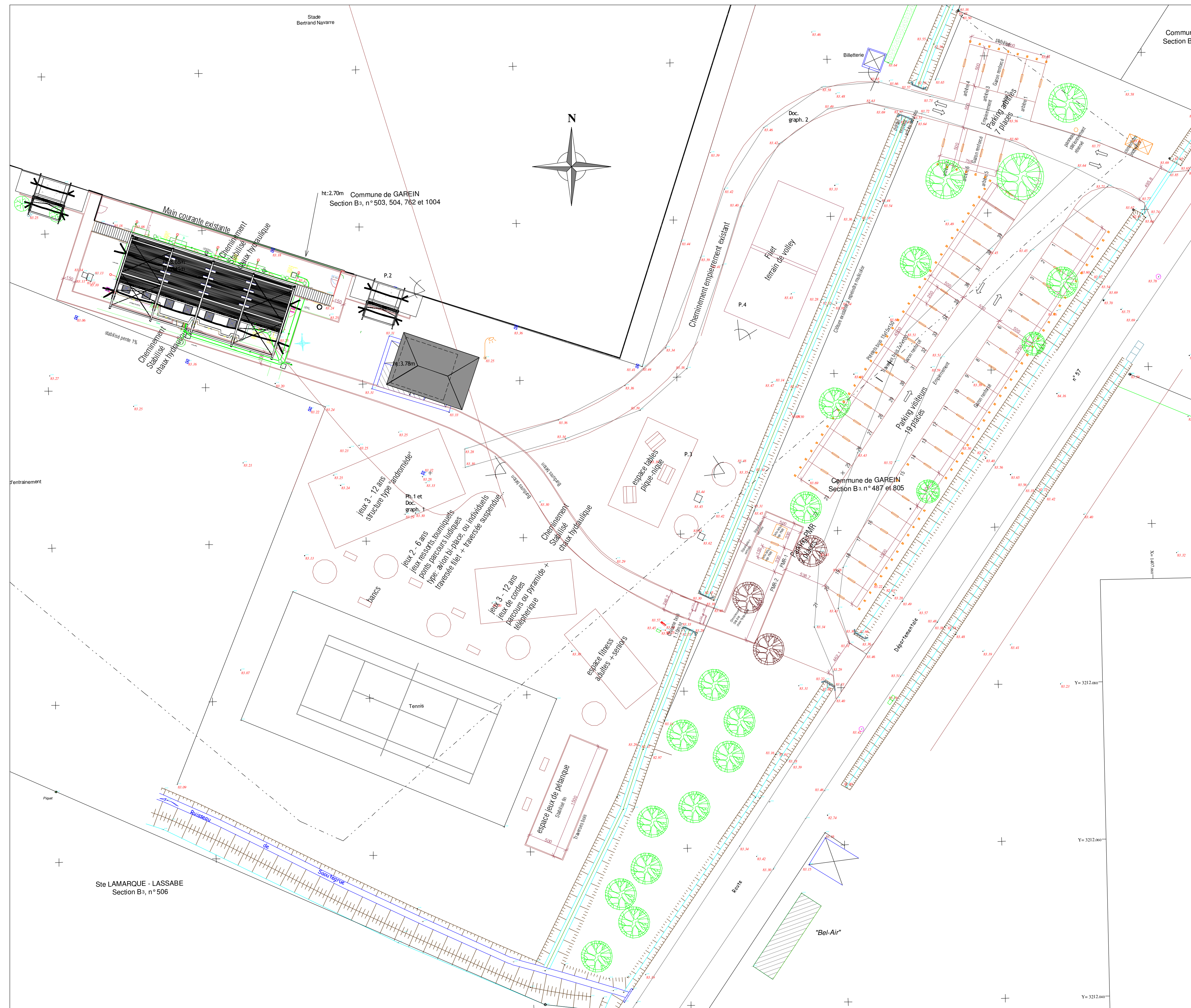
01-MASSE Ech: 1:200