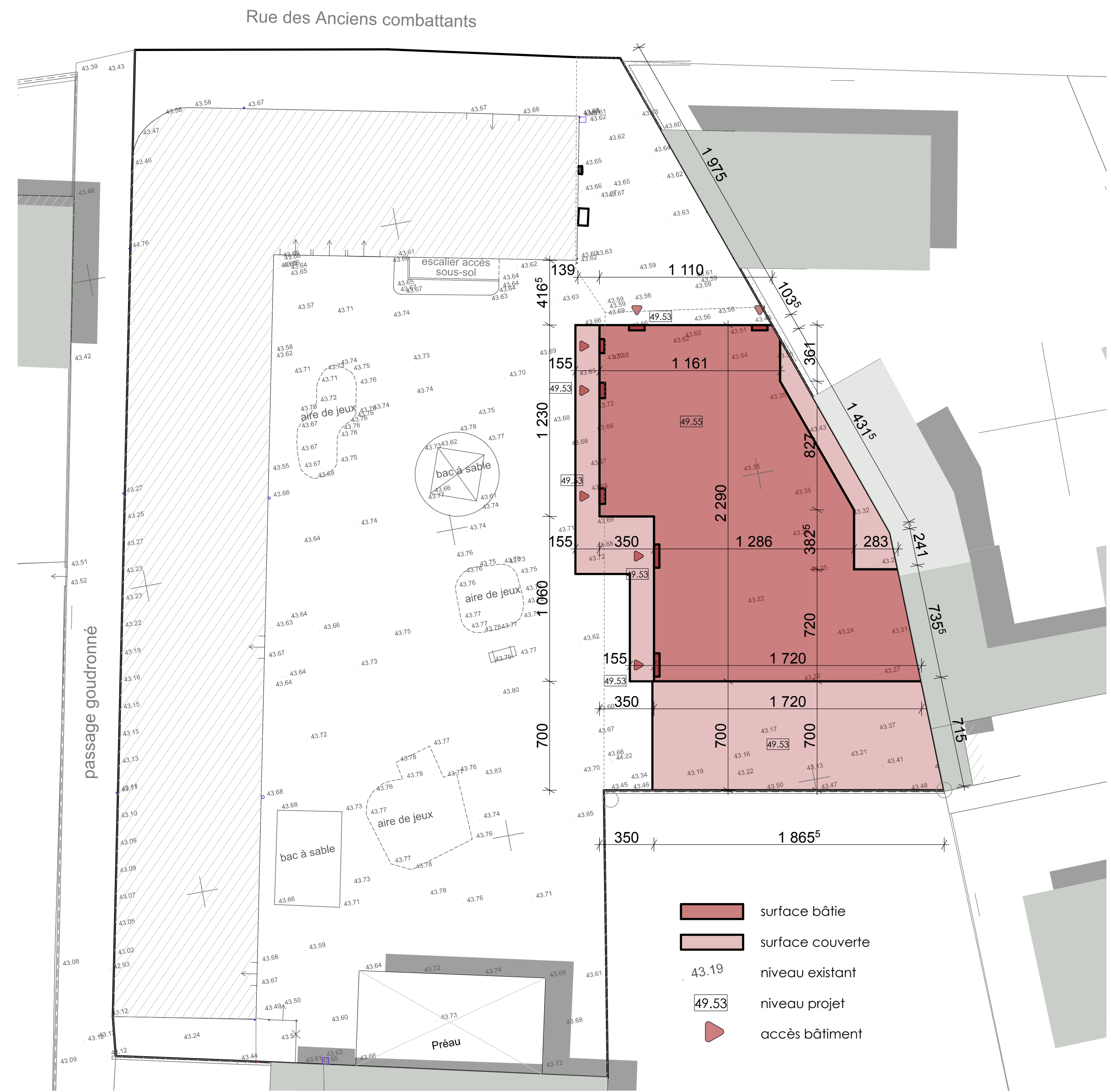
implantation éch : 1/200 ème