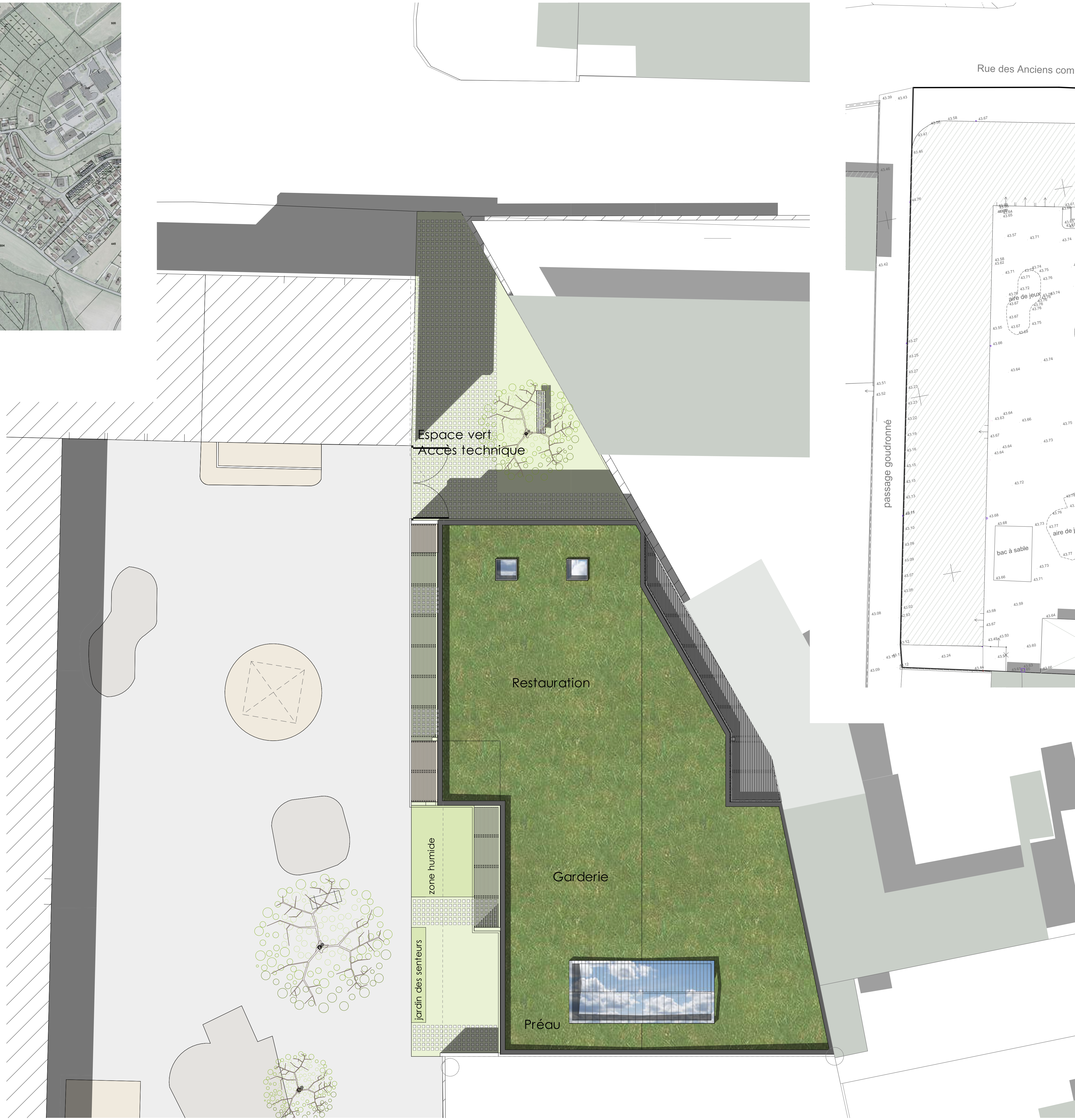
masse projet éch : 1/100 ème