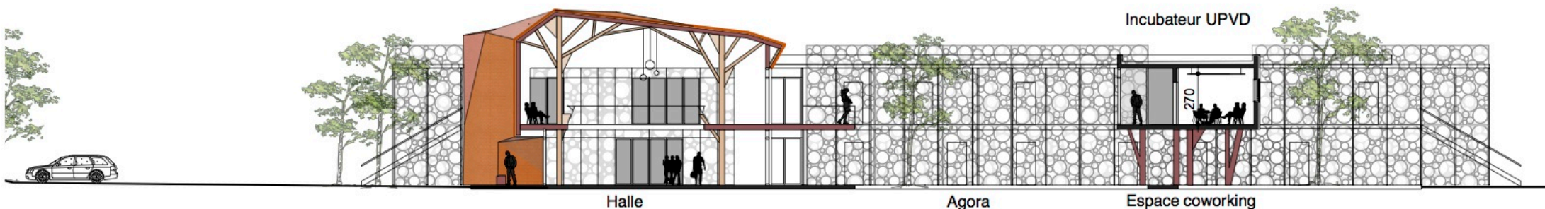
coupe longitudinale 1/200°