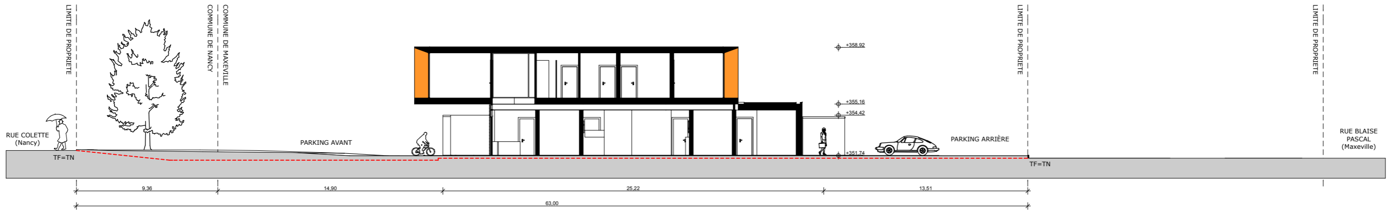
Coupe sur terrain