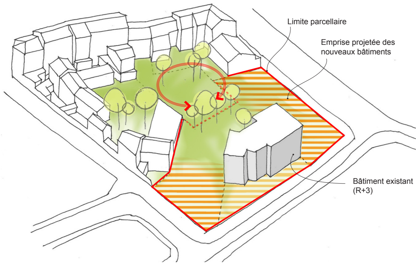
1. PRÉSERVER UN COEUR D'ÎLOT VÉGÉTAL