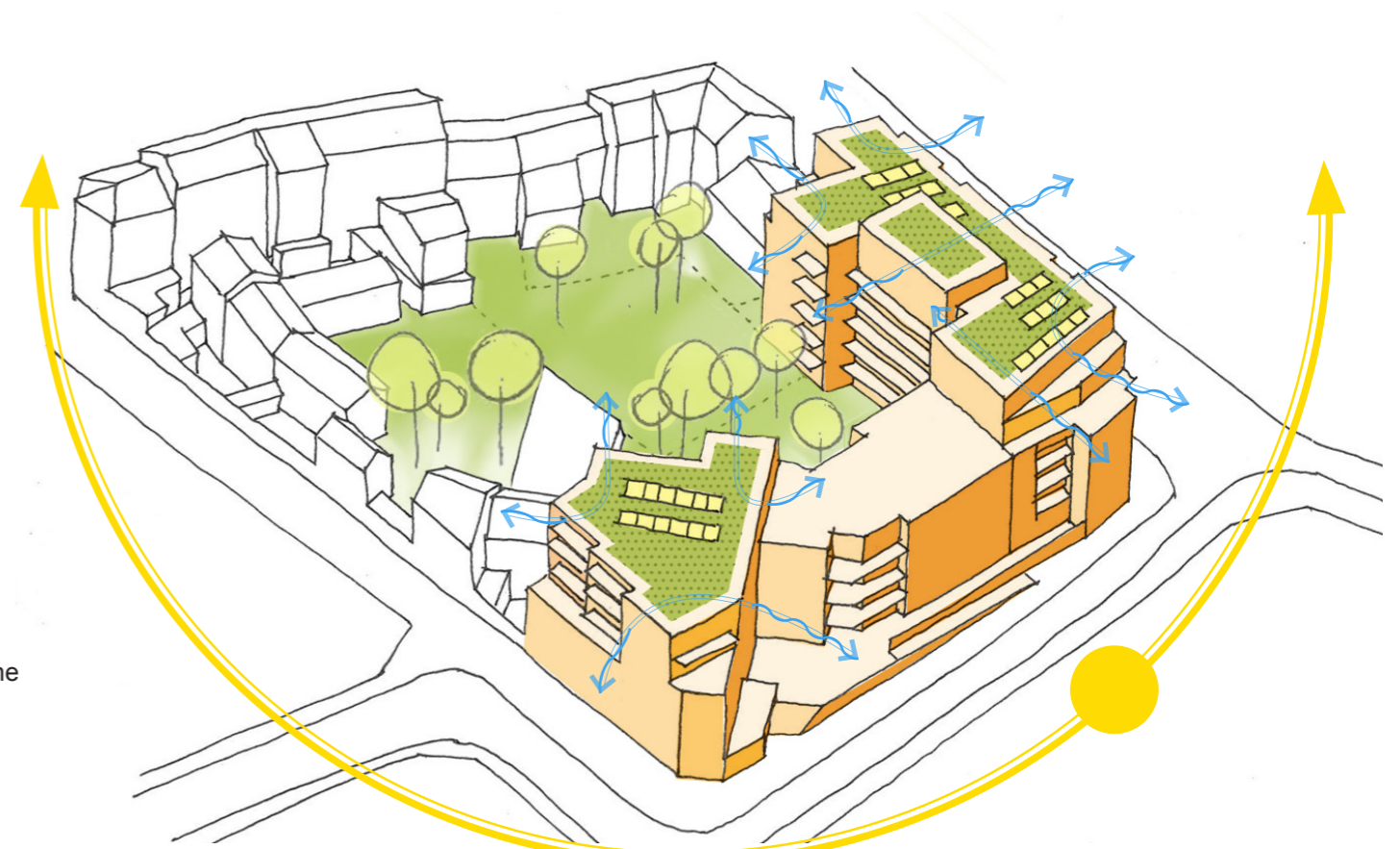
4. PROFITER D'UN ENSOLEILLEMENT MAXIMAL ET PRIVILÉGIER LES LOGEMENTS TRAVERSANTS